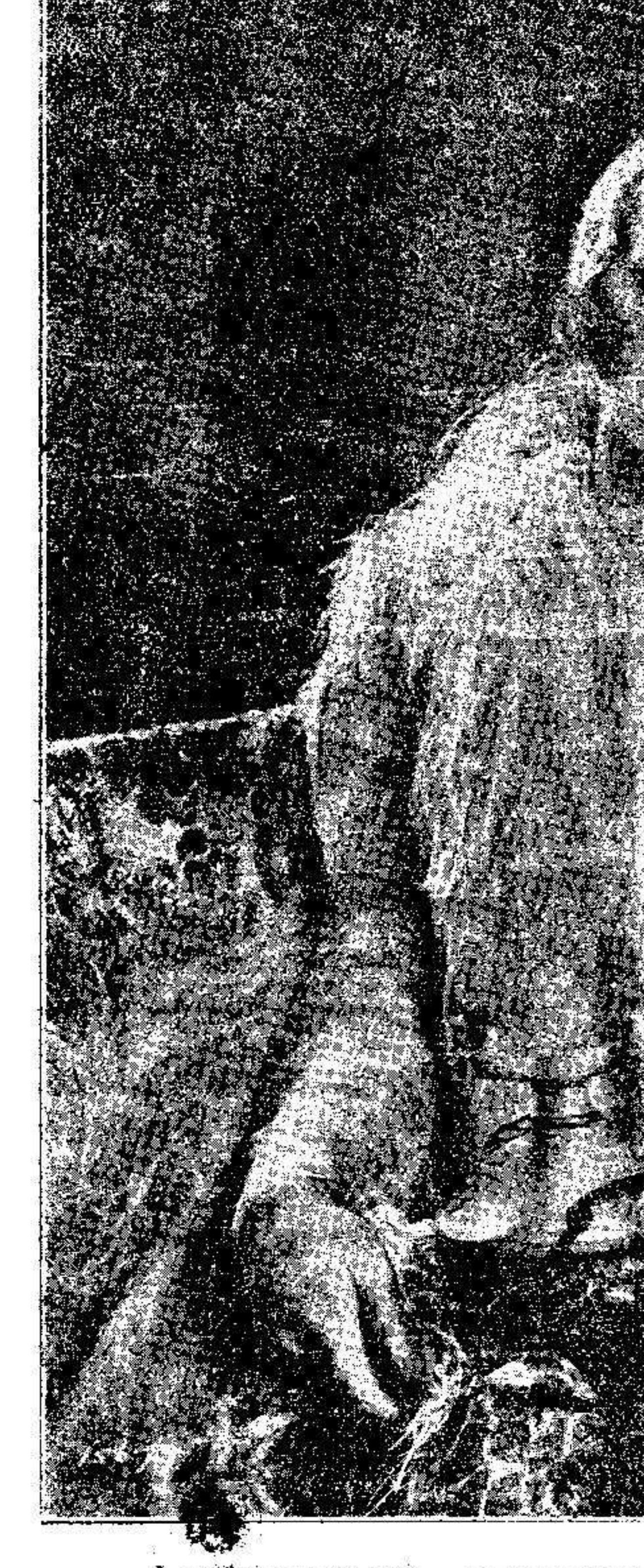
Leila Hyasus, artista que lo luce, ha sabido combinar el color de la prenda, con el tono del auricular, que al decir del gesto que muestra en la fotografía, la bella estrella de la pantalla, no parece transmitir palabras muy desagradables.