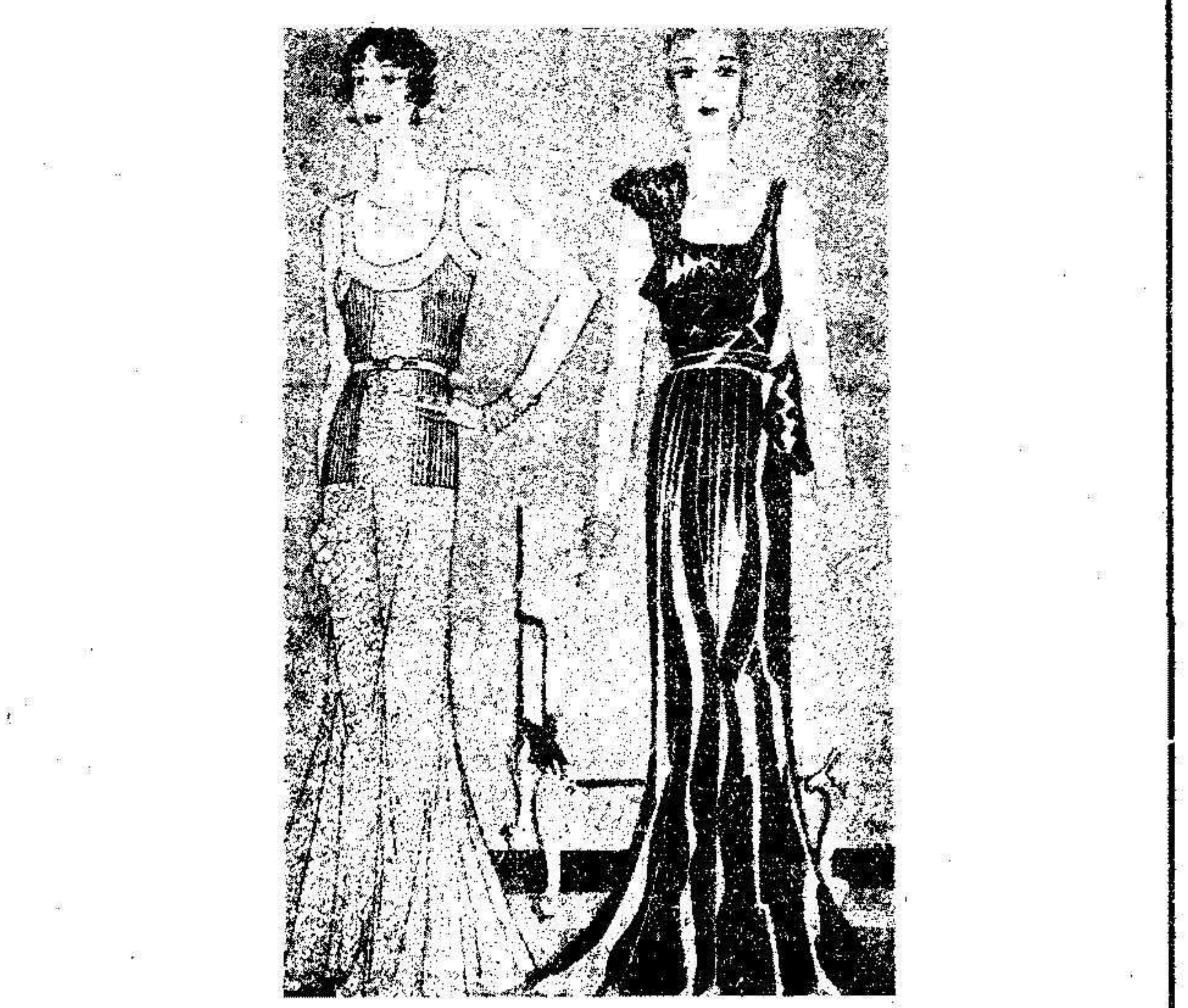
DOS ELEGANTES MODELOS DE NOCHE. El de la izquierda está confeccionado en encaje color de rosa. La falda es de amplio vuelo por abajo...