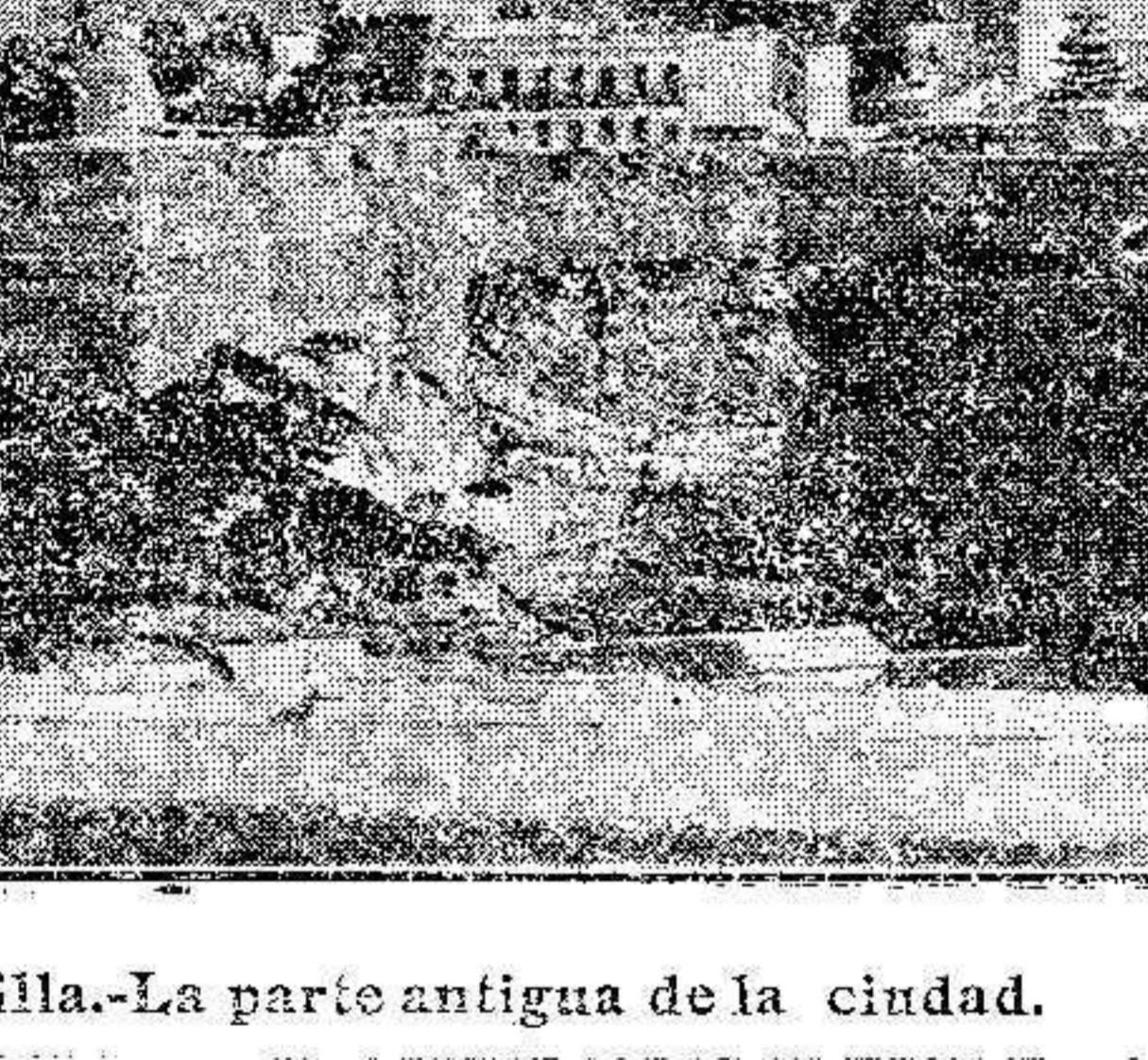
Melilla.—La parte antigua de la ciudad.