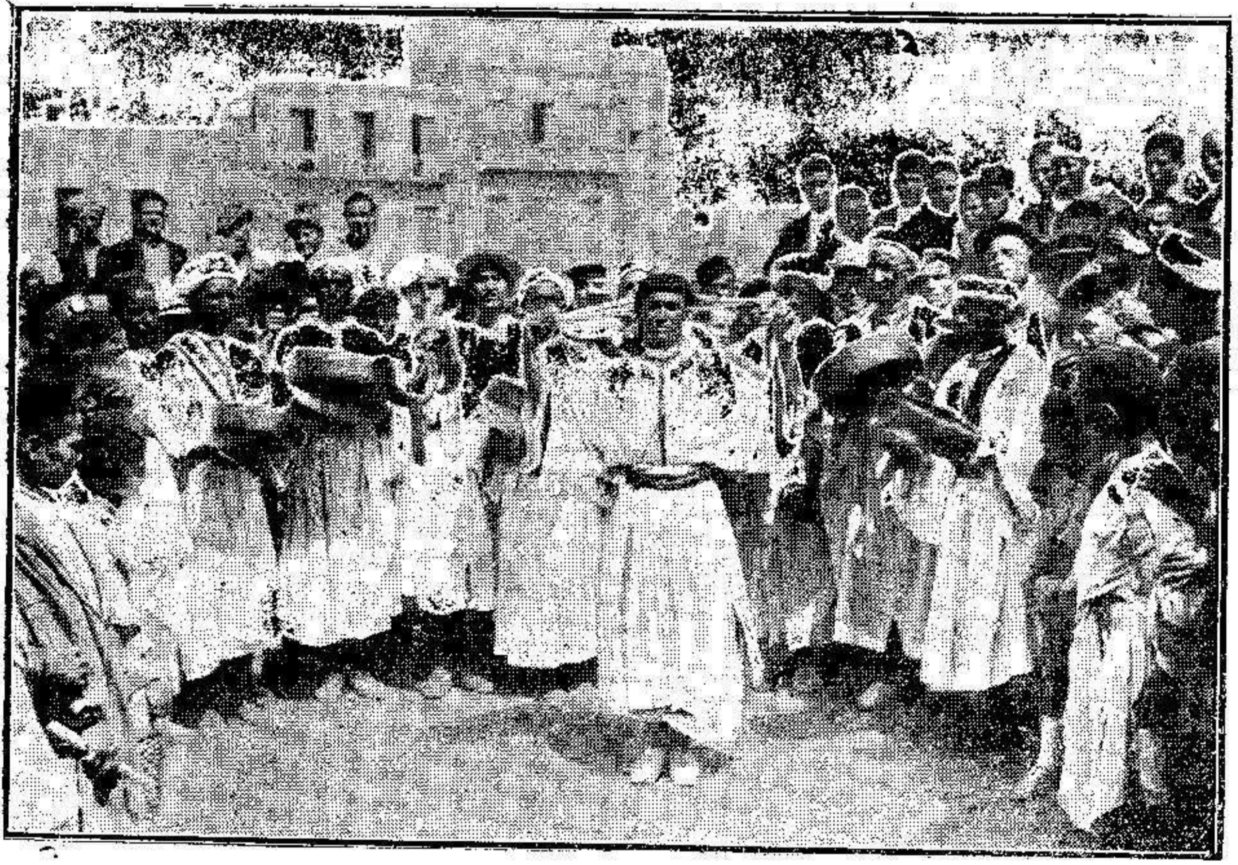
Músicos y bailarines indígenas que hacen las delicias de los concurrentes al zoco establecido cerca del Real de la Feria.

Los que suscriben están plenamente convencidos de que la única fórmula más práctica y prontamente viable, se condensa en las aludidas conclusiones