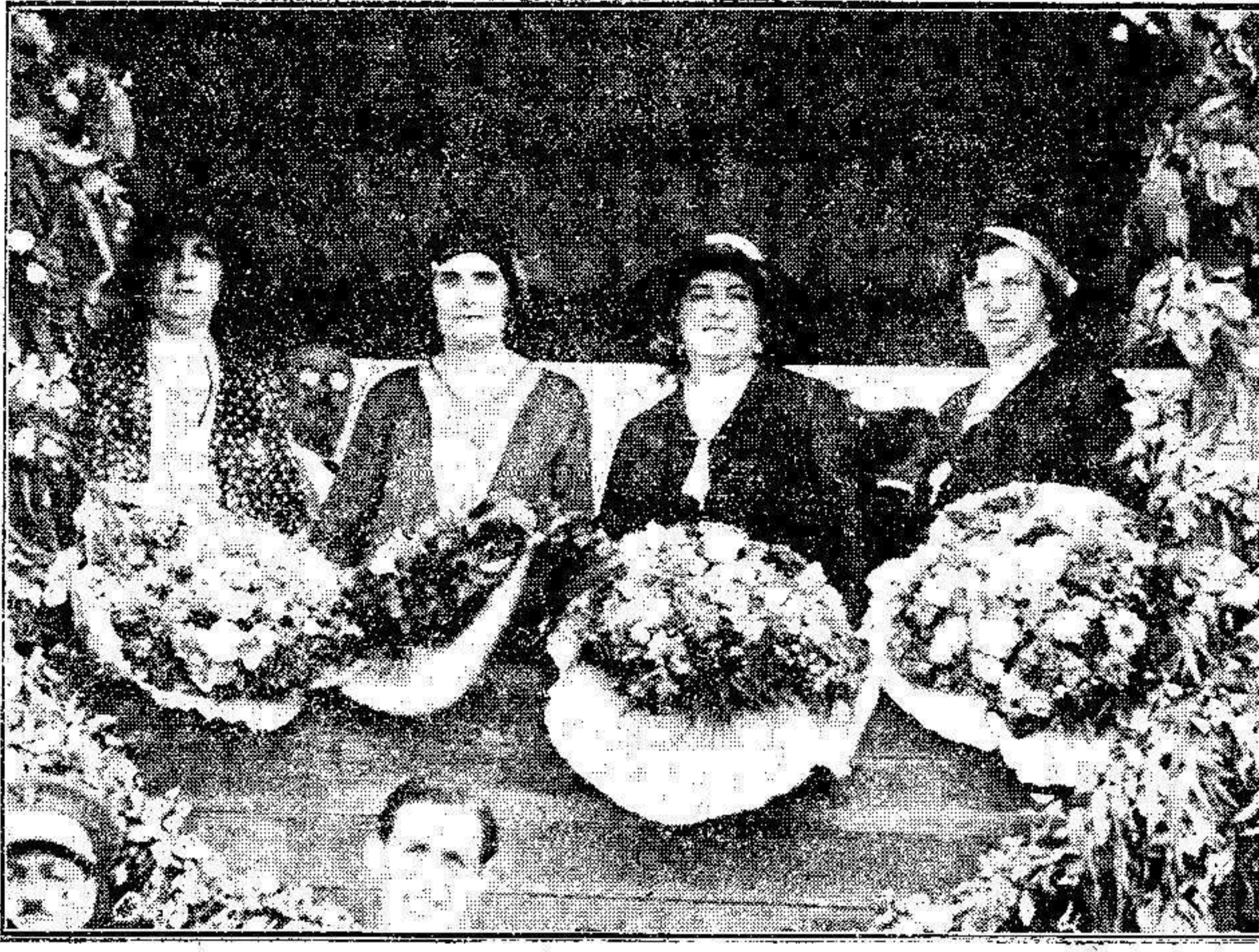
Las señoras de Pozas, Solans, Cuevas y Tur, que presidieron el partido de fútbol celebrado en el campo de la Real Sociedad Hípica, a beneficio de la Asociación de la Prensa.

En ningún otro país, como en la España del siglo XIII, alcanzaron los árabes y judíos mayor grado de civilización, ni florecieron hombres tan eminentes, entre filósofos, médicos, artistas, matemáticos, astrónomos, alquimistas, etc., de los que solo mencionamos, a más de los citados, Avenpace, su sucesor Abudeker, y su discípulo, el cordobés Averroes y entre los judíos su más conocido e influente filósofo Moisés Maimoni, latinizado, Moimoides.