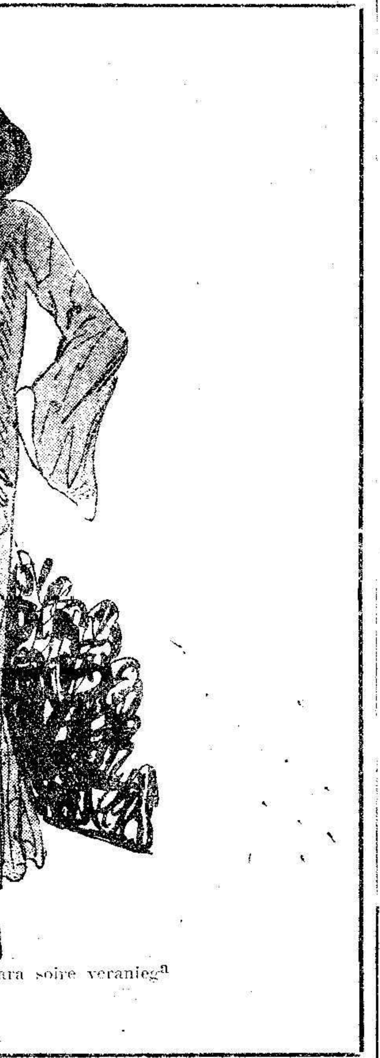
Interesante conjunto, para sobre verano.