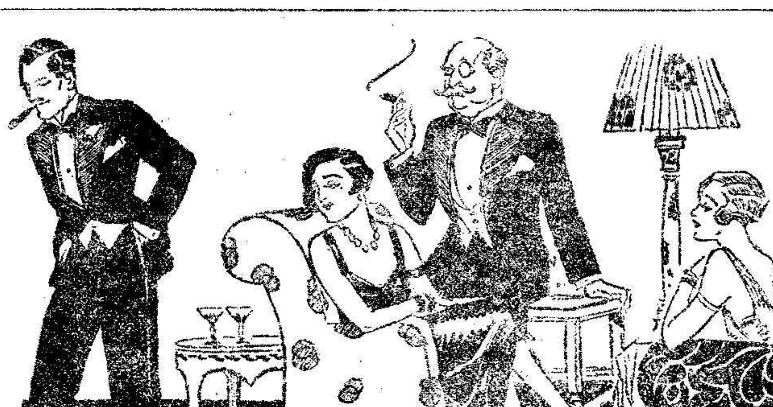
LOS PELIGROS DEL RATON

Los tres ocupantes del coche solo sufrieron, por verdadero milagro, heridas de carácter leve. El vehículo quedó completamente destruido.