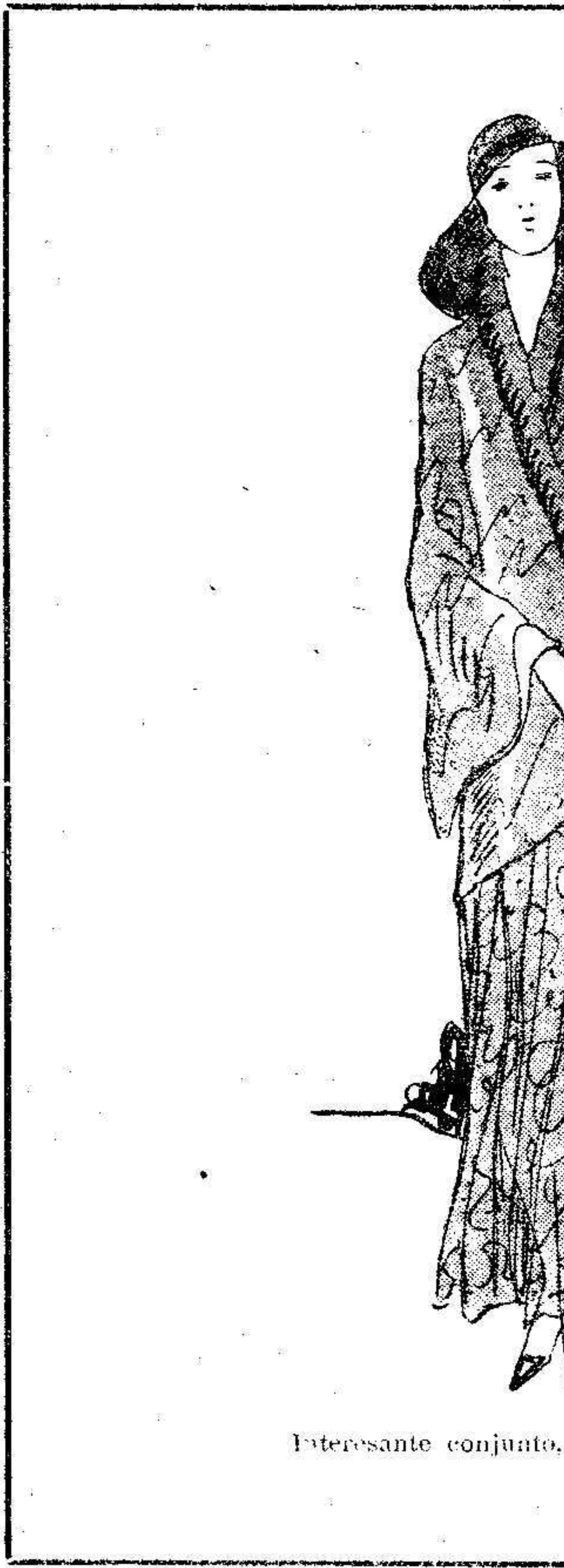
Interesante conjunto, para sobre verano.