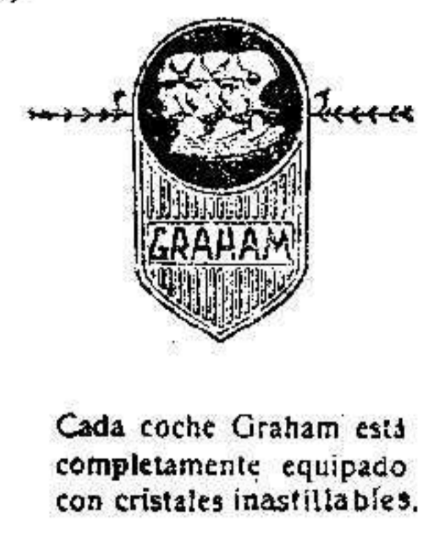
Cada coche Graham está completamente equipado con cristales inastillables.

Añádase a esta nueva seguridad la perfección de su transmisión de cuatro velocidades, la elegancia de su trazado, y su perfecto y constante rendimiento, y así, su atracción se hace irresistible al comprador más exigente y entendido.