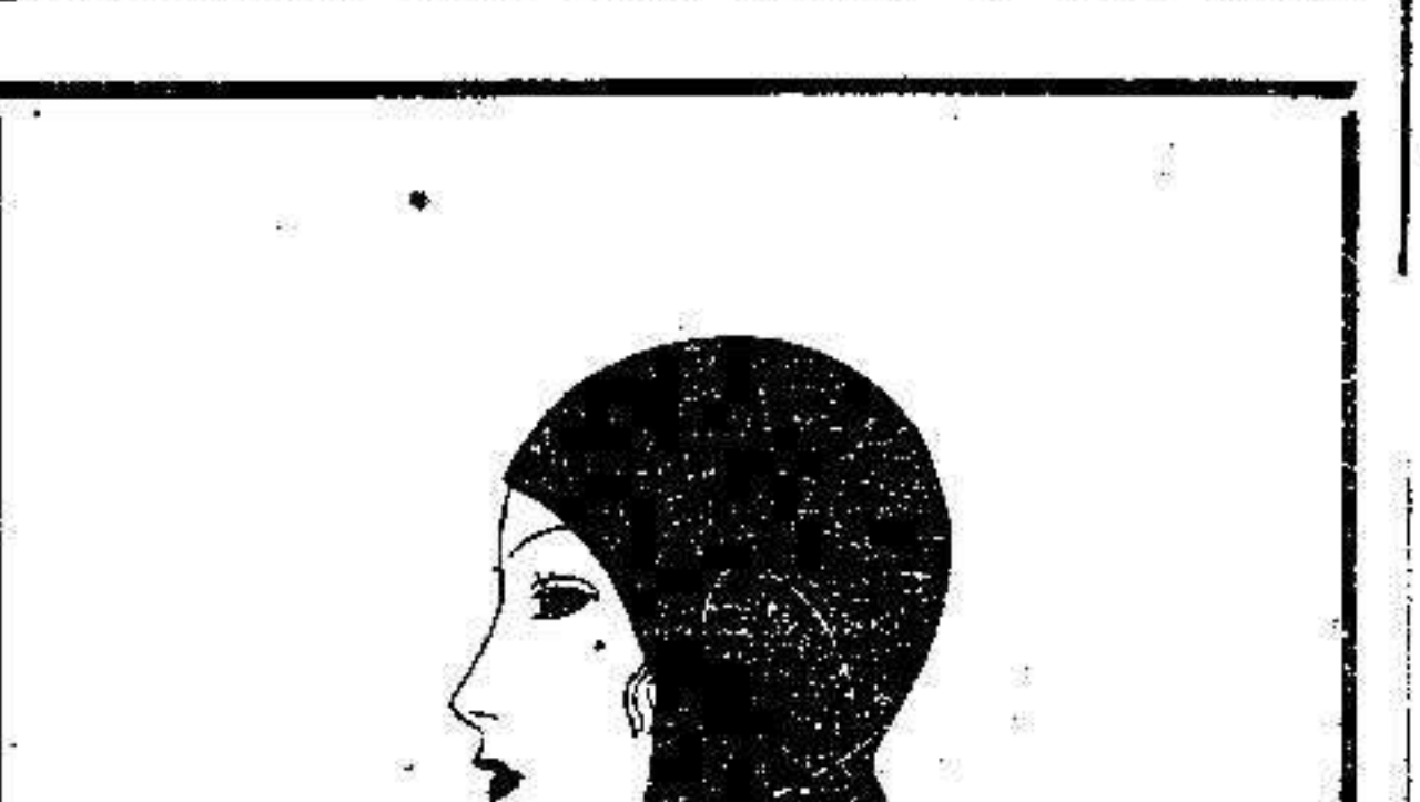
Dos elegantes modelos de sombreros

Las buenas lanas de los beige, se procurarán unir con sedas, lo que dará