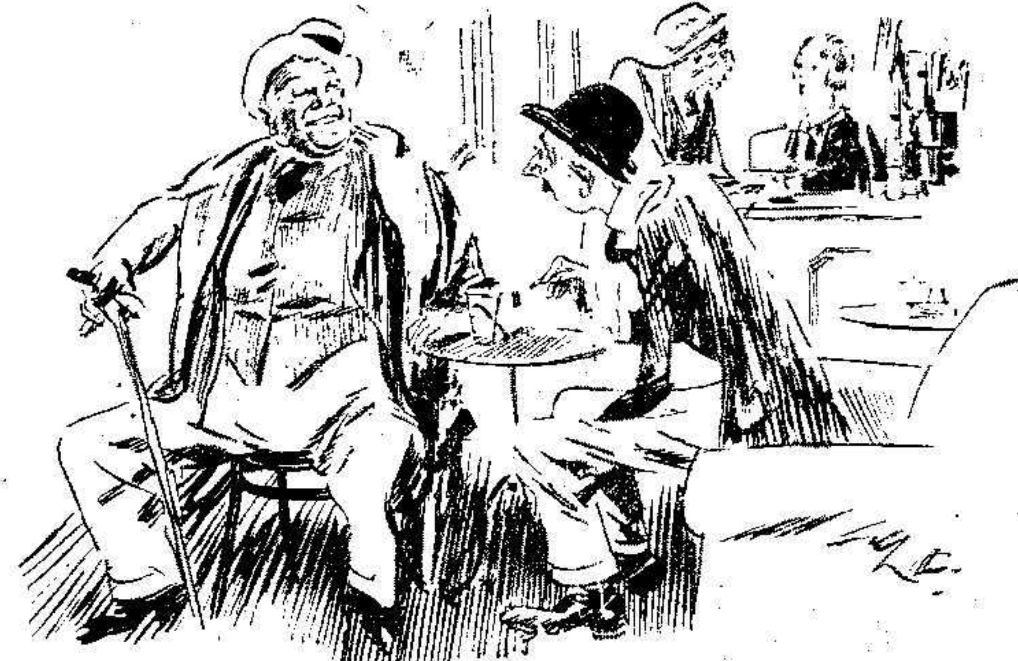
LOS ETERNOS SABLISTAS

En su domicilio fué víctima de un sensible accidente la bella señorita Gloria Ipiens, causándose lesiones de alguna importancia.