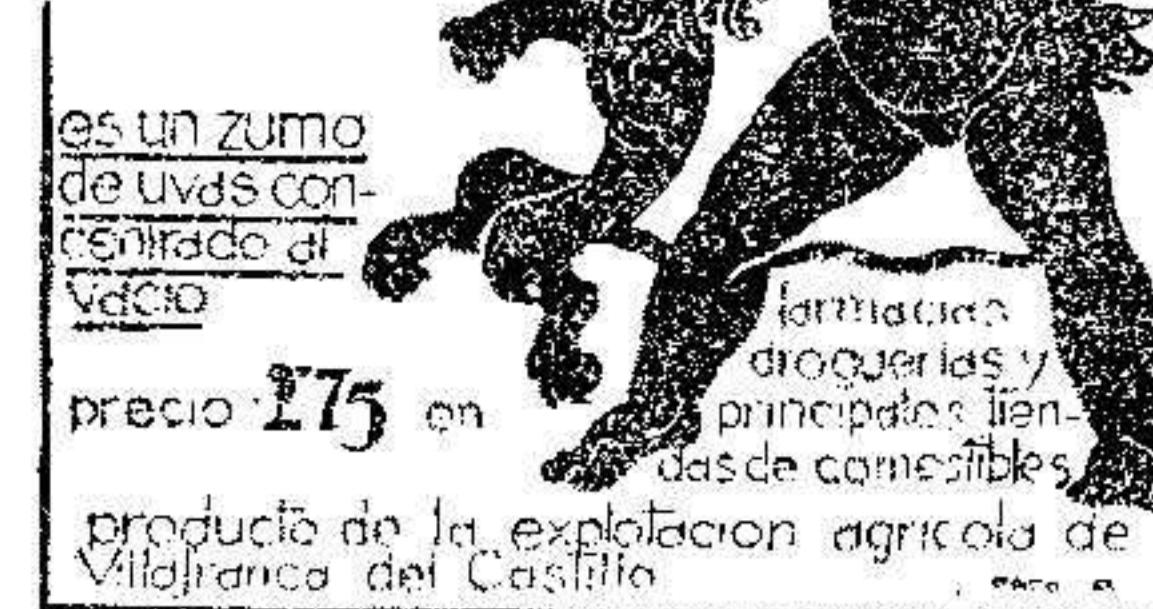
Prohibida la reproducción.

En el muelle fueron recibidos por las comisiones receptoras.