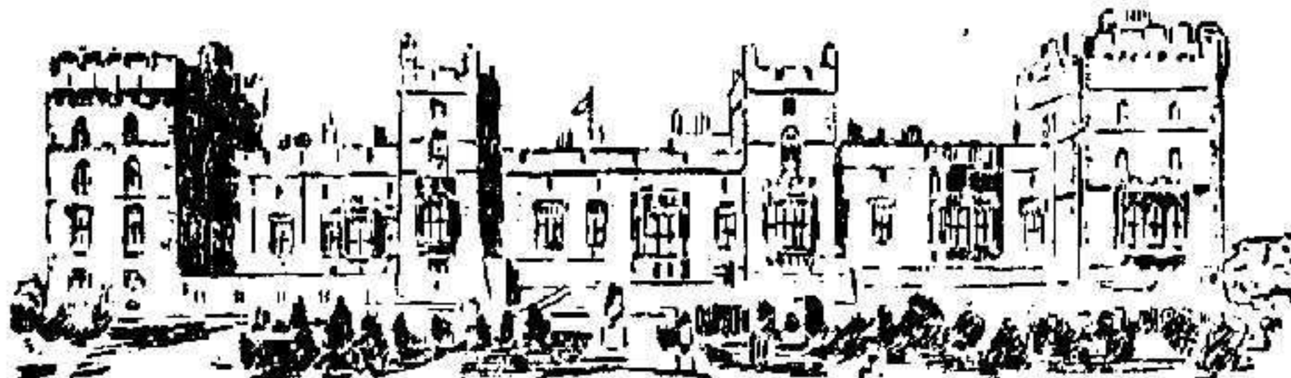
Castillo de Windsor

cia la salida de las mehallas que envía á campaña, y con la segunda encarga á Si-Aixa-Ben-Omar que escriba cartas á los cónsules para captarse sus simpatías.