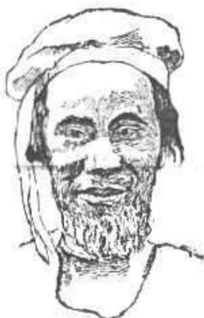
El morabito Azul

Segun nos comunica nuestro corresponsal en Magador, ha llegado á Marrakech el célebre agitador Ma-El-Ainín con ochocientos de sus más fieles partidarios.