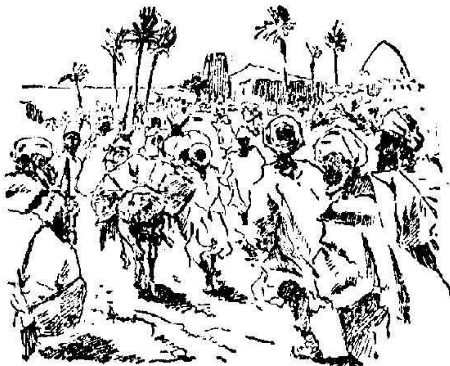
Grupos de moros de Fedala huyendo del bombardeo.

Marruecos carecía de medios, pudo recurrir á Francia y España principales interesadas en evitar el aprovisionamiento de las kabilas.