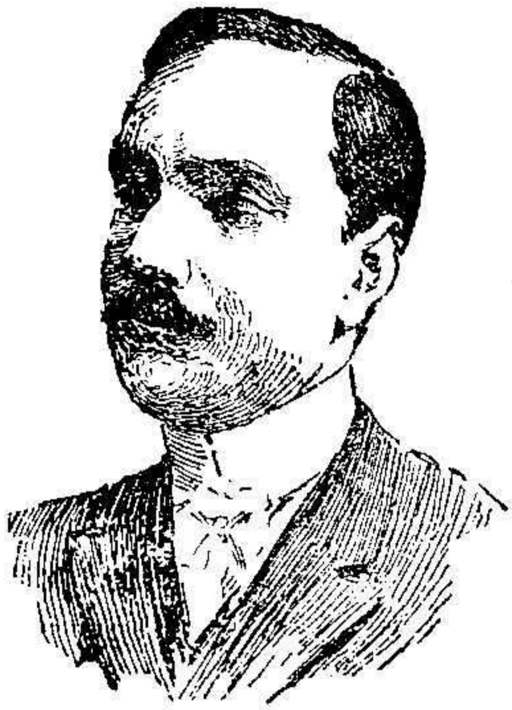
Don Luis M.ª Drago

Hoy que todas las miradas de las grandes potencias convergen hacia las decisiones de la Conferencia de la Paz y que todos los estadistas y las personas cultas observan lo que en la Haya se debate, la figura de Drago, el eminente político argentino, se destaca briosamente de las allí reunidas.