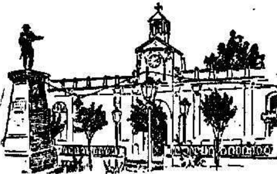
CHILPACINGO—El Palacio del Gobernador destruido por el terremoto

El aspecto general de la ciudad no puede ser más atractivo, pues aunque de edificación, si se exceptúa el Palacio del Gobierno y el Teatro Santa Cruz, su conjunto es bello y agradable.