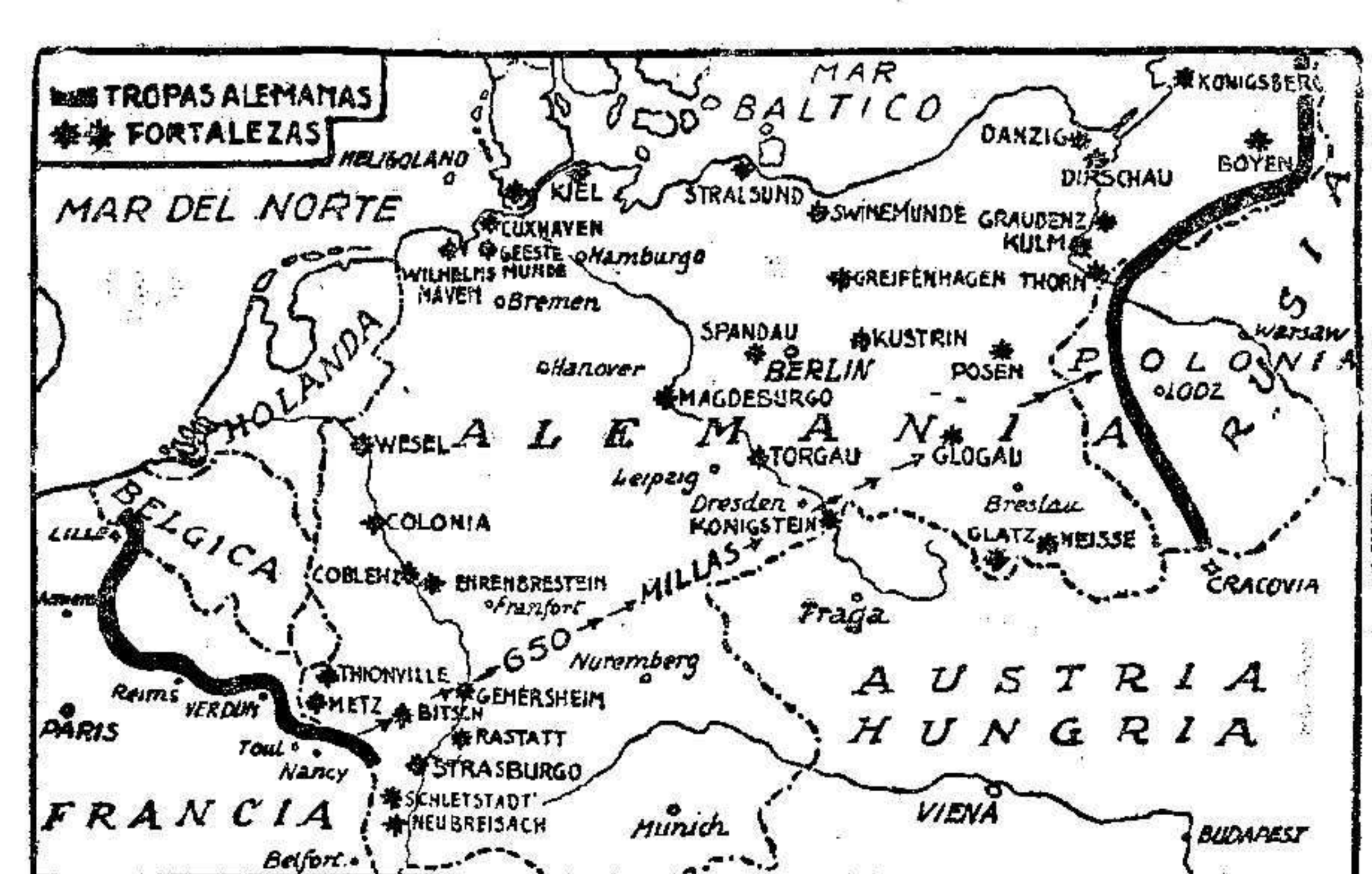
El mapa indica los frentes aproximados de los ejércitos alemanes que operan en Francia, en Prusia y en Polonia.

Nuestra felicitación á la nascente Sociedad, y de modo especial á la Directiva y comisión organizadora, á las que agradecemos las distinciones de que nos hicieron objeto.