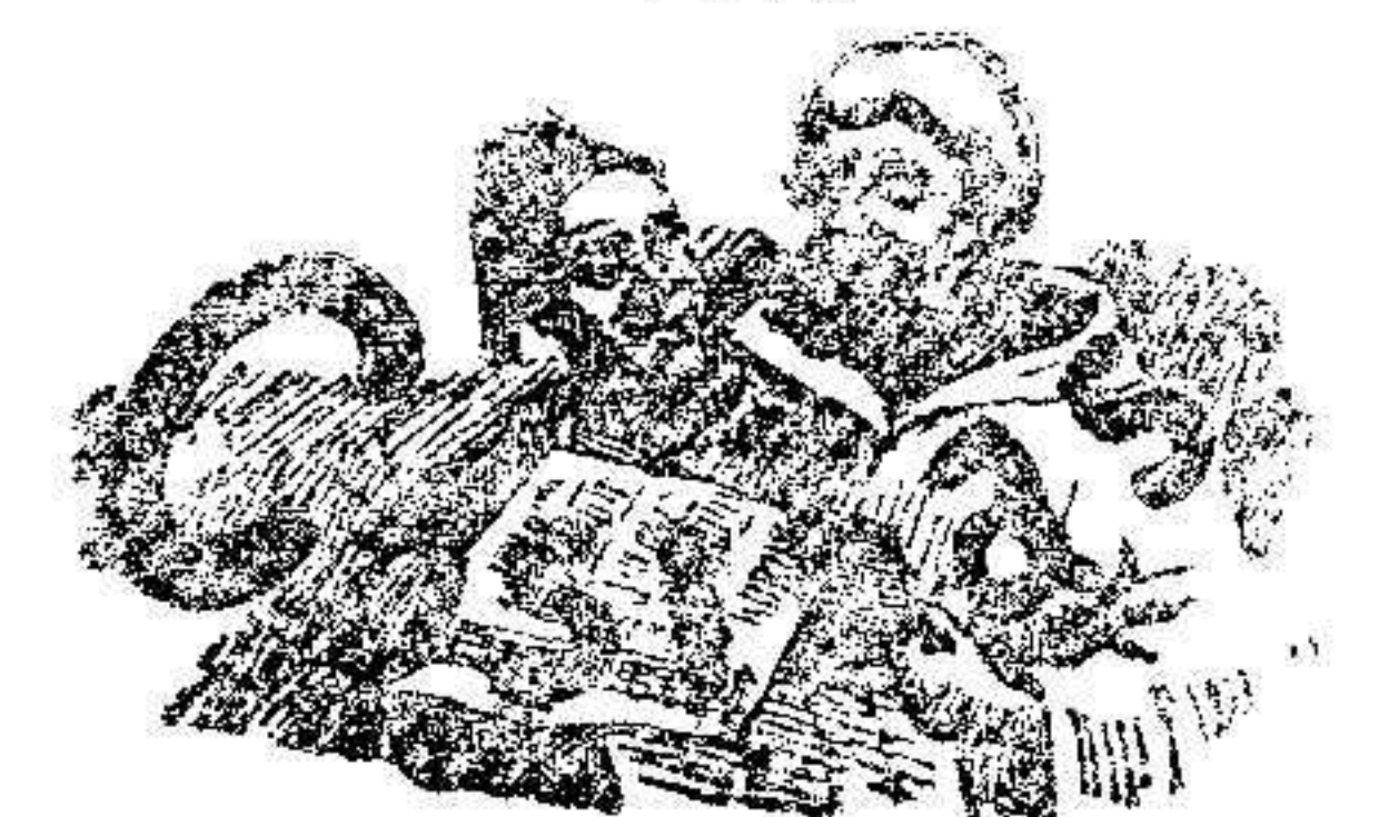
El palco de los periodistas : : :

En el Puesto de Socorro fué curado el lesionado de primera intención, pasando luego á presencia de la correspondiente autoridad.