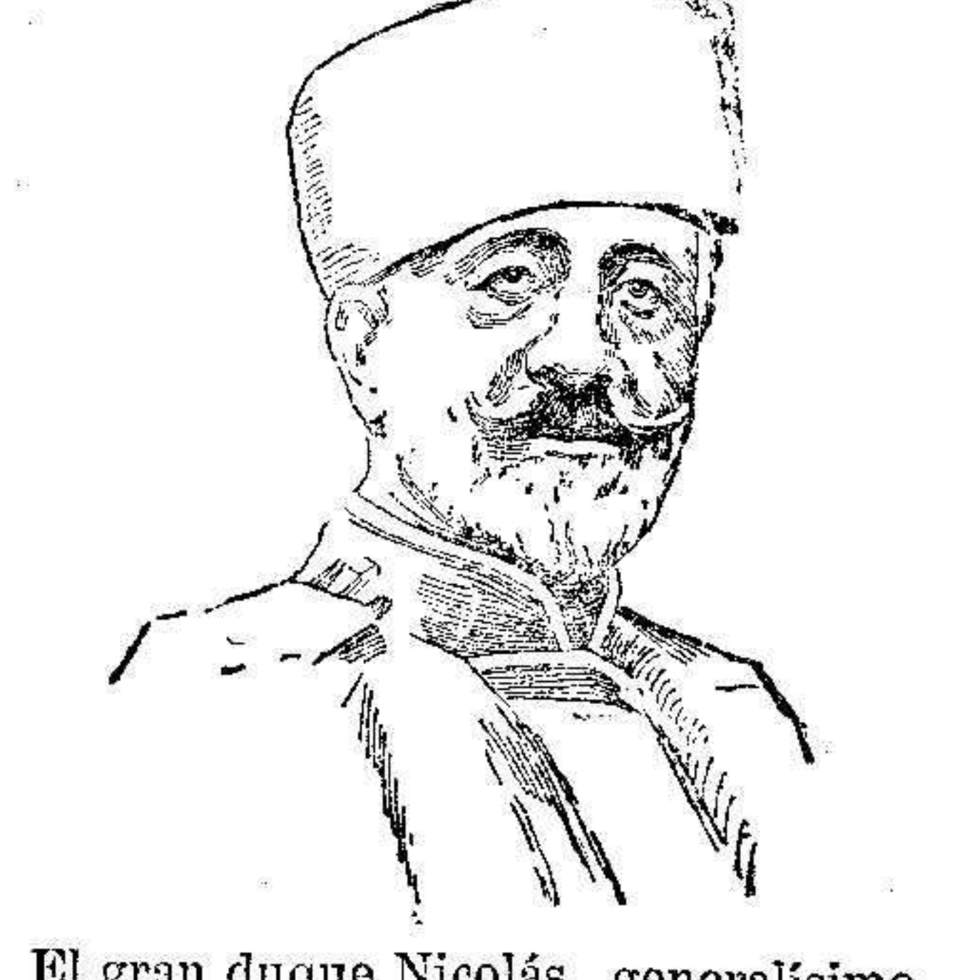
El gran duque Nicolás, generalísimo de los ejércitos rusos.

Yudah. Importantes noticias en ULTIMA HORA