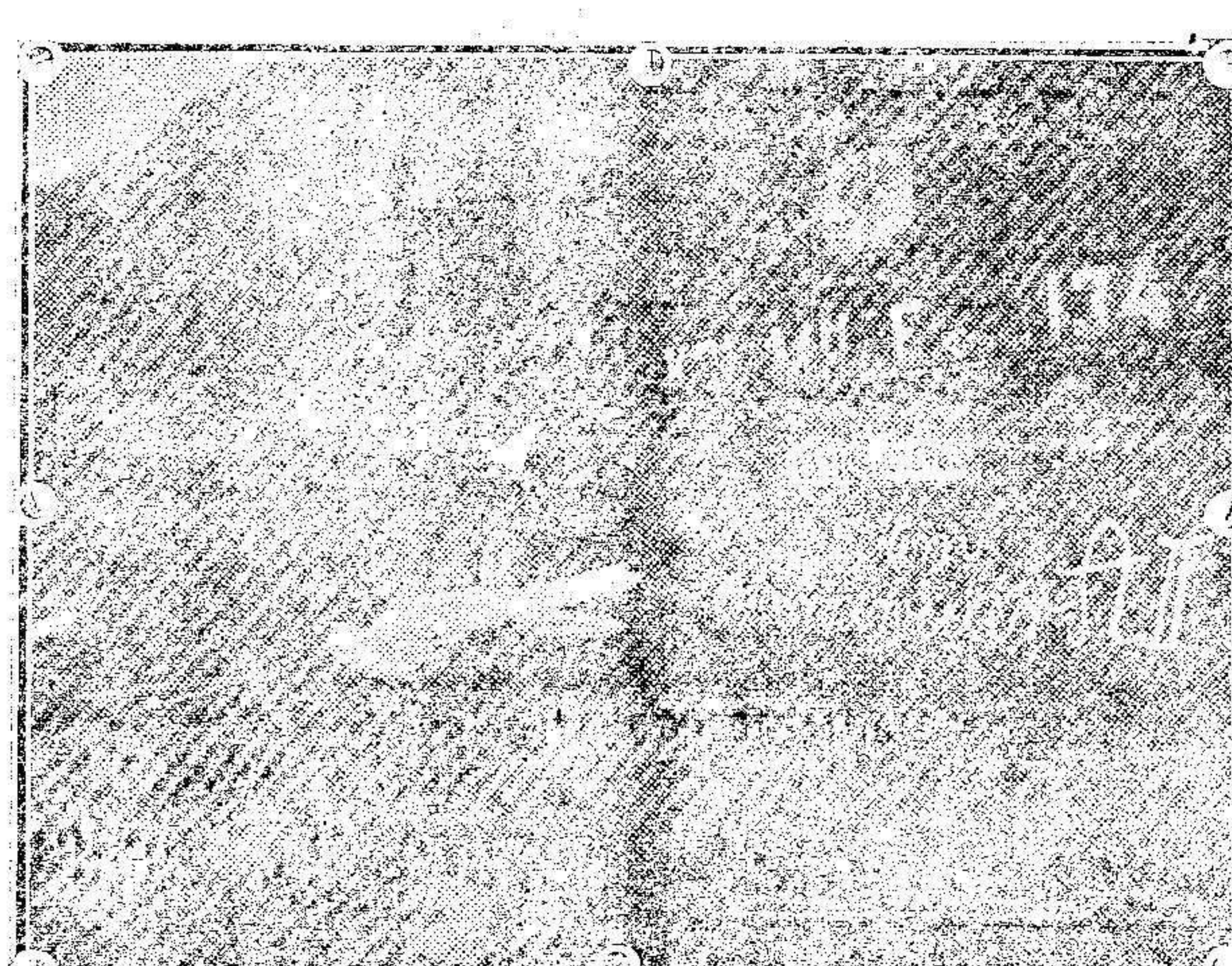
Heridos alemanes transportados en los vagones de los trenes hospitalarios

Noticia de la batalla de Gránish y de la batalla de Lemberg.