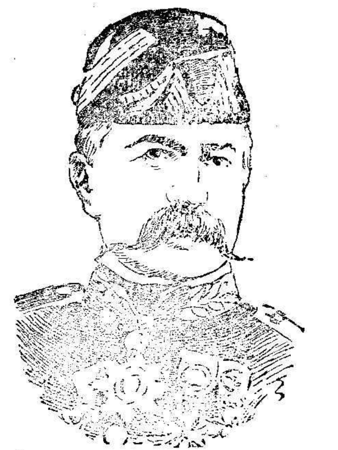
General Leman, heroico defensor de Lieja, que ha caído prisionero de los alemanes.

Este periódico se ocupa en su artículo de fondo, de la cuestión palpitante, y dice que España entera quiere la neutralidad. Si hubiera compromisos secretos con alguna nación, el Gobierno debe romperlos, pues el pueblo, que los desconoce, los da por nulos y los rasga.