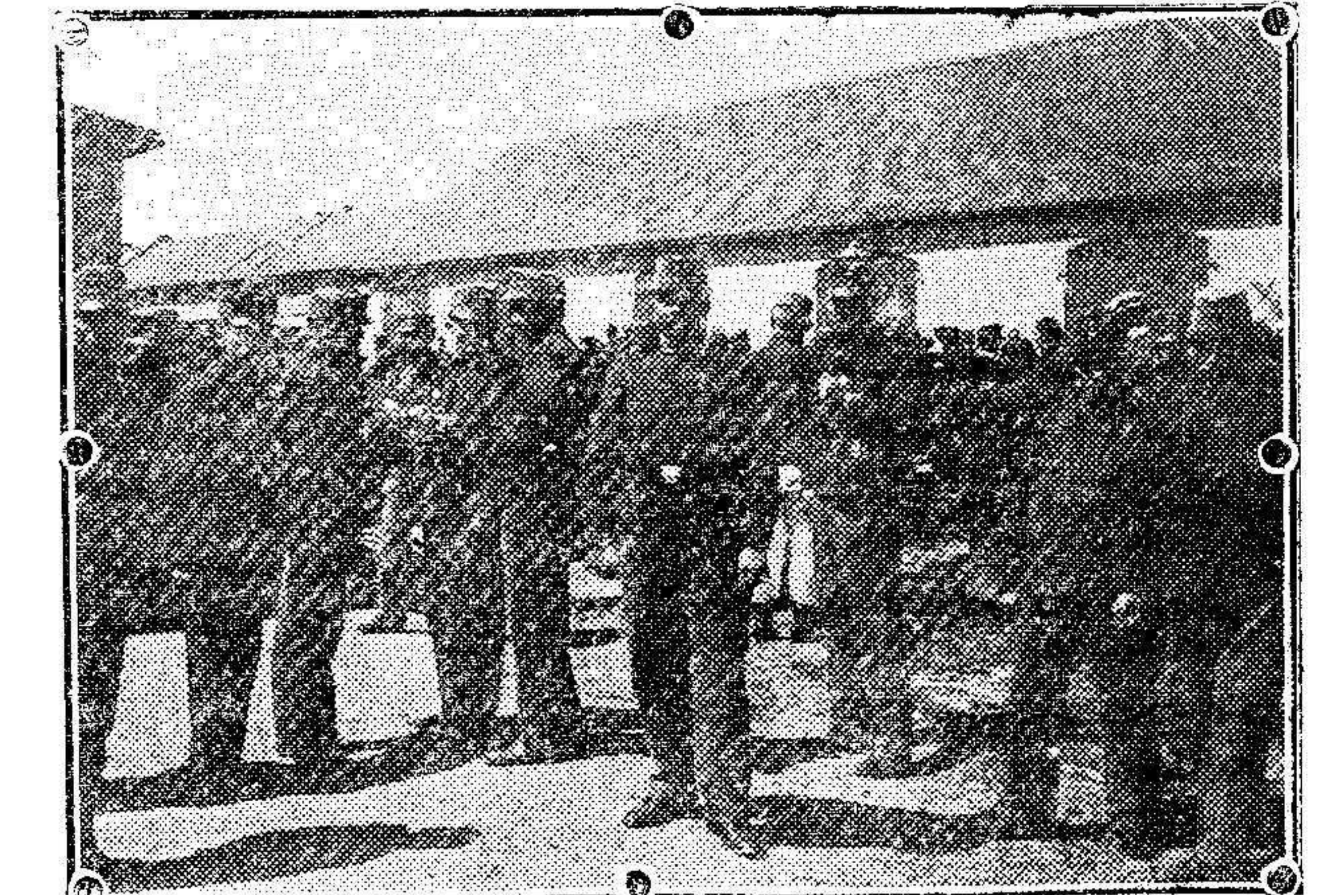
La movilización austriaca. El equipo de los reservistas que han sido llamados á filas.

sin trabajo, que en algunas provincias no admite ya demora de ninguna clase. El carbón. Noticias de la guerra. En la Cámara de los Comunes. Respecto al carbón mineral el señor Dato ha indicado que parece existen temores de que pueda elevarse su precio. El Gobierno no pierde de vista este asunto y si es preciso llegará á adoptar medidas encaminadas á fijar un límite á los precios. Trató luego de la cuestión internacional.