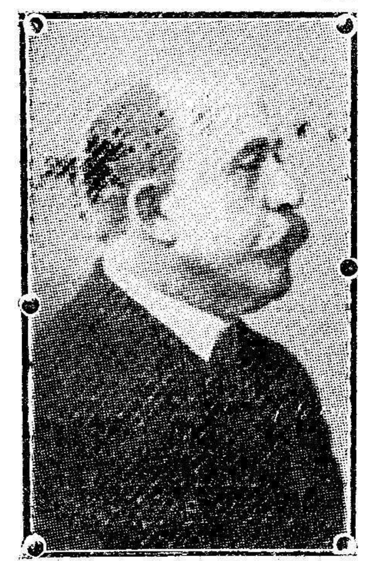
El Barón de Sacro Lirio, recientemente fallecido en Madrid.

En efecto á juzgar por las palabras de Schoen en el ministerio de Negocios ex-