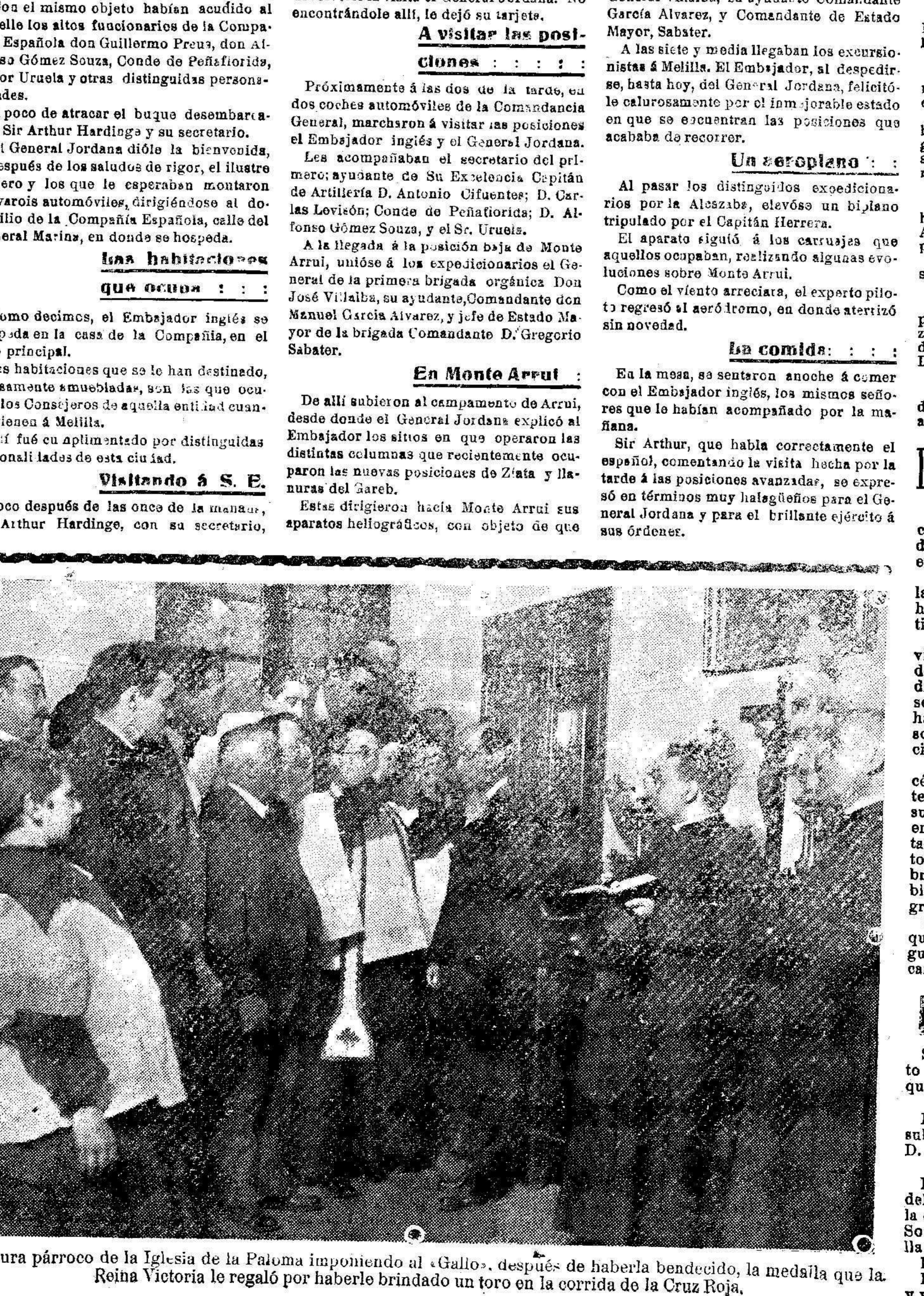
El cura párroco de la Iglesia de la Paloma imponiendo el «Gallo», después de haberla bendecido, la medalla que la Reina Victoria le regaló por haberle brindado un toro en la corrida de la Cruz Roja.

Oficialmente ha tenido lugar la apertura de la red telefónica urbana de Melilla, que está ya funcionando á satisfacción de todos. Se trata de una importantísima mejora que iba ya siendo imprescindible, dado el desarrollo que la población había tomado y las grandes distancias que separan á los distintos barrios. El comercio estaba necesitado de ese servicio que al fin es á ya establecido y lo propio ocurría con el vecindario en general y las dependencias oficiales. Cada día que pase aumentará el número de abonados, dada la comodidad que el teléfono representa y no cabe dudar que dentro de un año las instalaciones á domicilio se habrán multiplicado. Los abonados han recibido un pequeño folleto conteniendo las instrucciones que es preciso seguir para pedir comunicación y conferenciar y las condiciones generales del abono, siguiendo una relación de las personas suscritas por orden alfabético y con la numeración correspondiente. Felicitemos á la empresa y hacemos votos por su prosperidad.