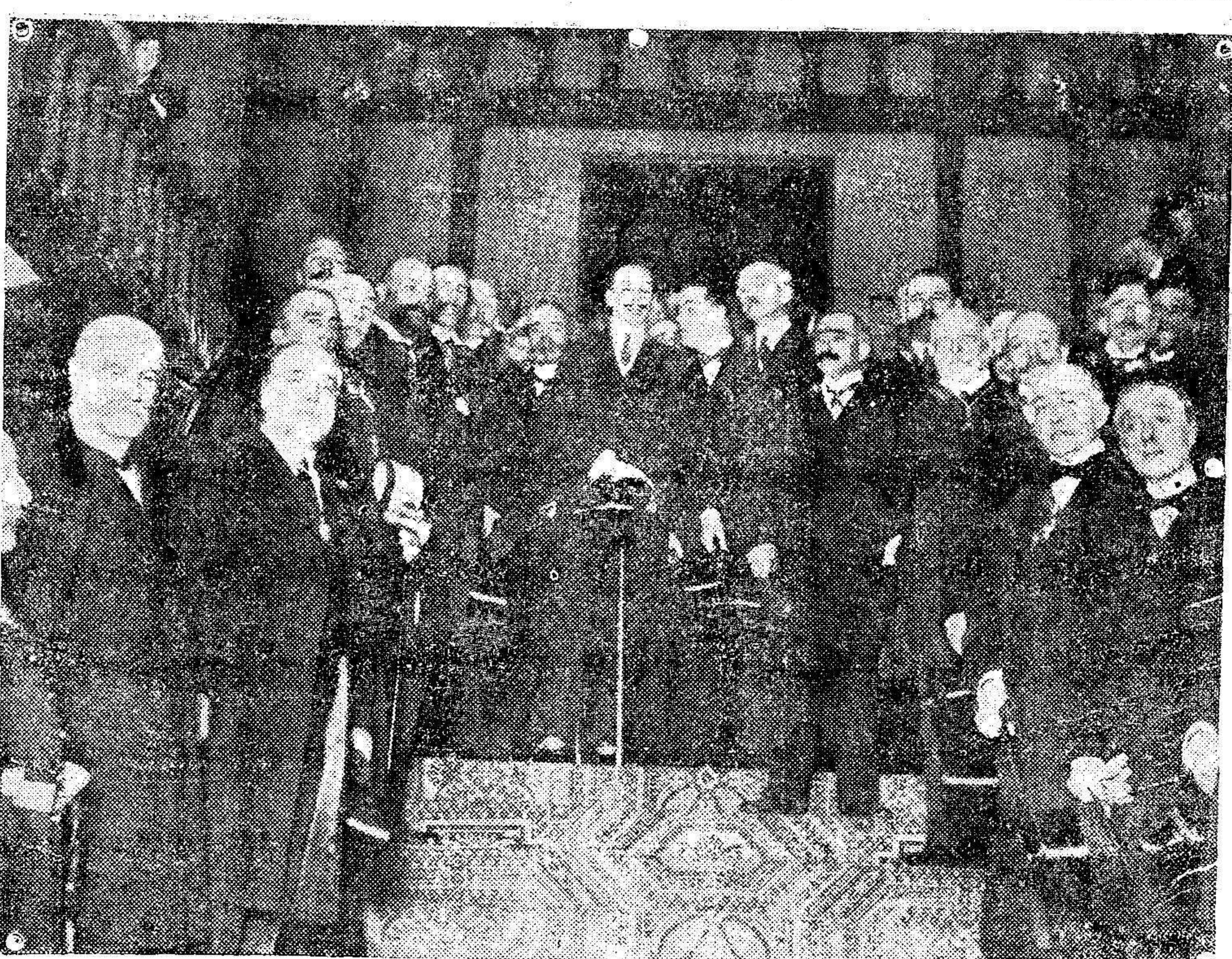
S. M. el Rey en la Academia de Buenas Letras, de Sevilla.

«Cámara de Comercio de Melilla.—Número 98.—Enterados por la prensa del noble y patriótico propósito de ese Centro de su digna dirección de celebrar en una de las plazas españolas del Norte de Marruecos, una exposición de productos hispano-africanos, nos apresuramos á manifestarles nuestros deseos de que se celebre dicha exposición en la plaza de Melilla toda vez que es la más comercial de las posiciones españolas del Norte de Marruecos pues en el tráfico con el Imperio, en las demás es casi nulo mientras que en la de Melilla es importantísimo, añadiendo á ella no solo moros de las habilitas limitadas sino también de las más apartadas regiones del Maghreb. A esta petición una la Cámara, el más sincero ofrecimiento de cooperar con el mayor entusiasmo á tan laudable fin á medida que nuestras fuerzas lo permitan.