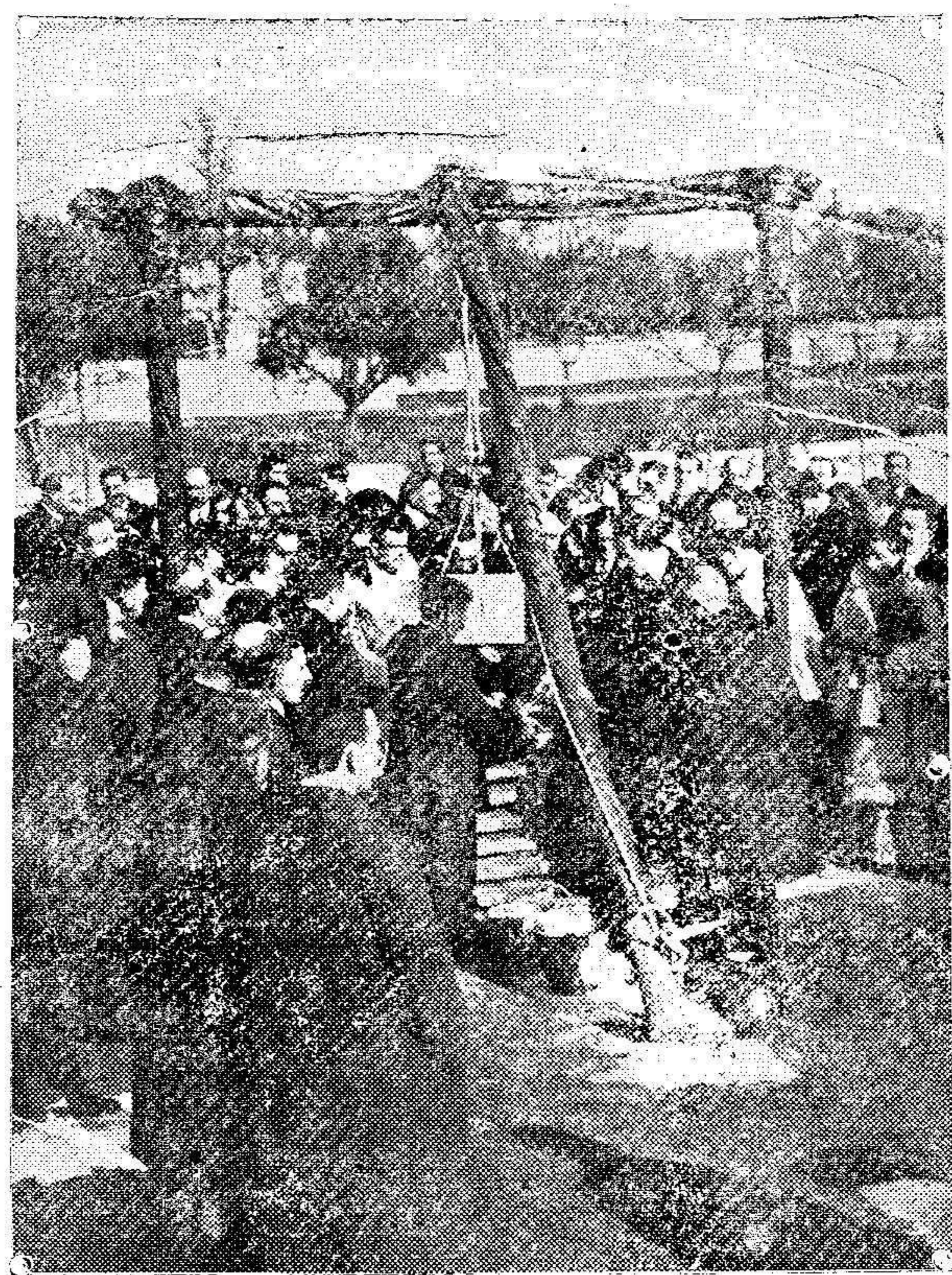
Su Majestad el Rey colocando la primera piedra de uno de los hoteles de la colonia de la Pransa.

Clases prácticas de contabilidad. Preparaciones de carreteras civiles. O'Donnell G. Para detalles al Sr. Interventor del Banco de España. 239