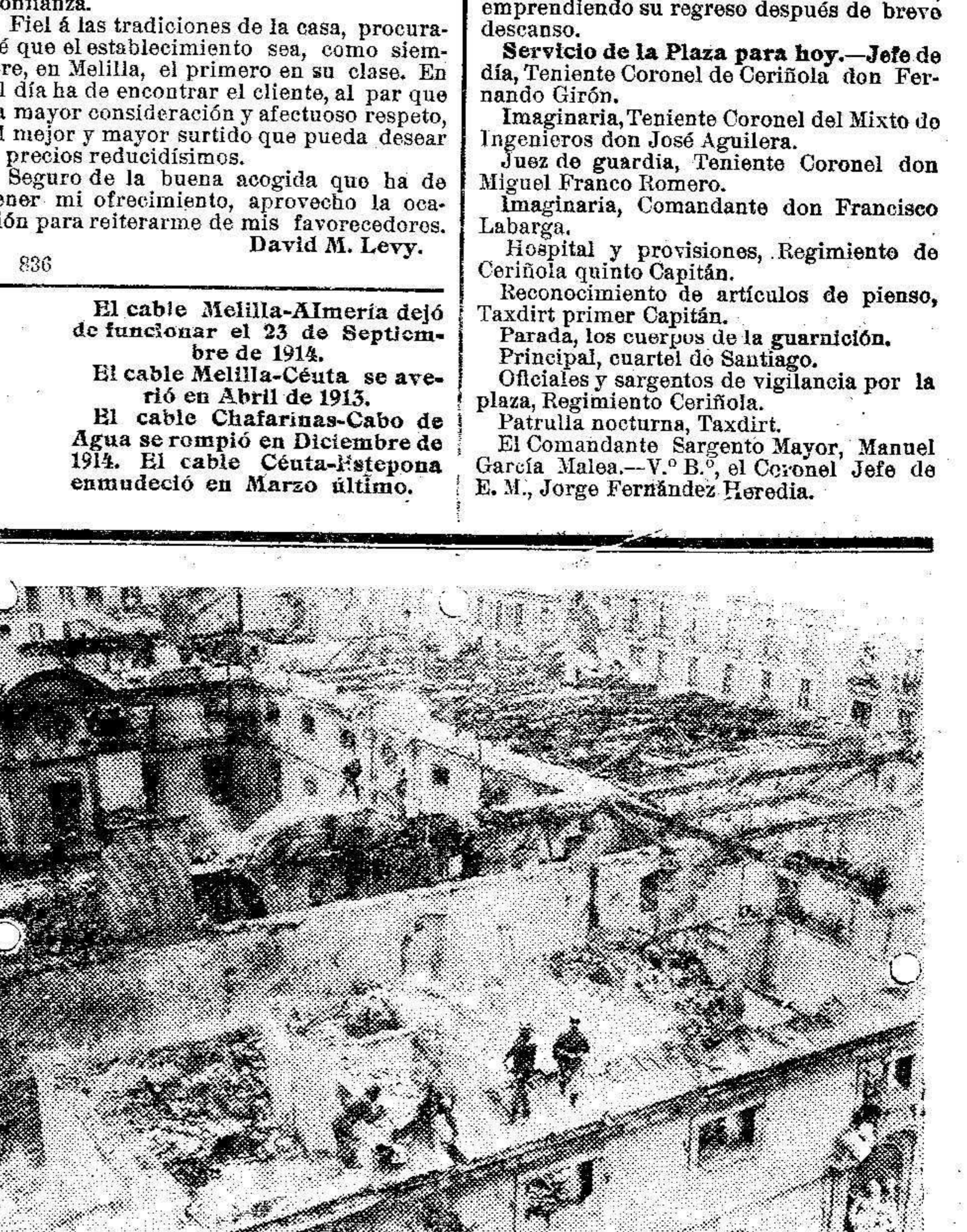
Vista general del edificio de las Salesas después del incendio