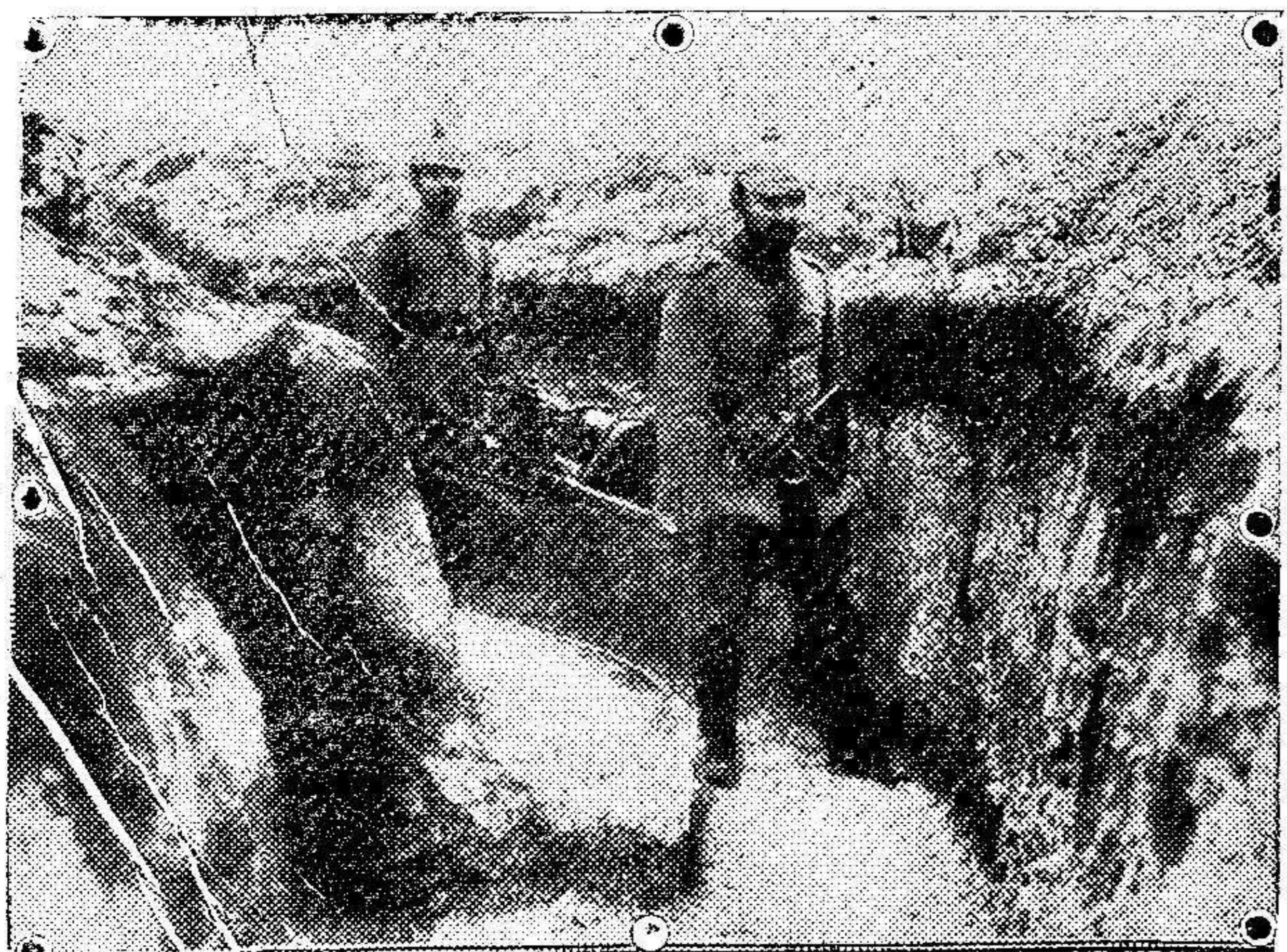
Conducción de un herido.

LA VILLA DE MADRID se ha trasladado á calle Padre Lerchundi, número 4 (antiguo local del café Universal). 741