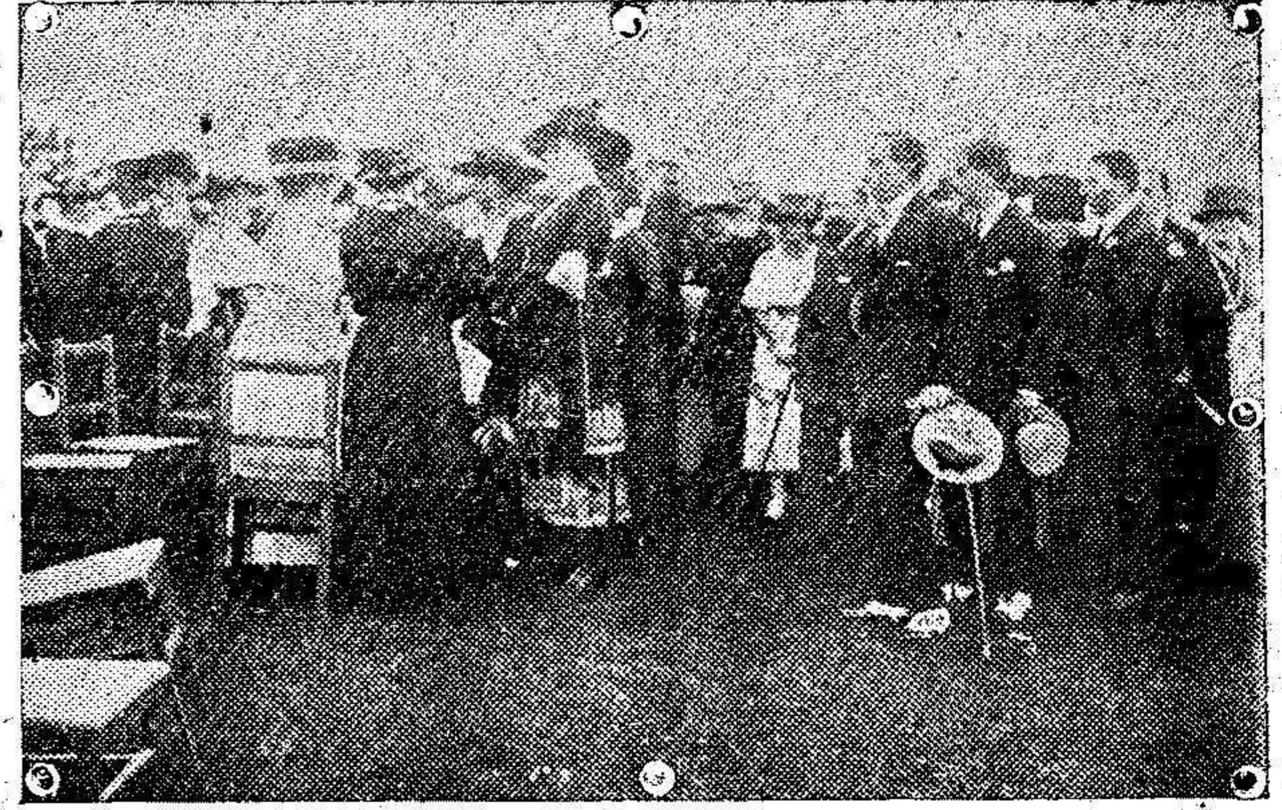
La Reina hablando con distinguidas señoritas en el hipódromo de San Sebastián.

También ha quedado arreglado el cuartel de Infantería que, como es sabido, se habilitó para enfermería y ahora servi-