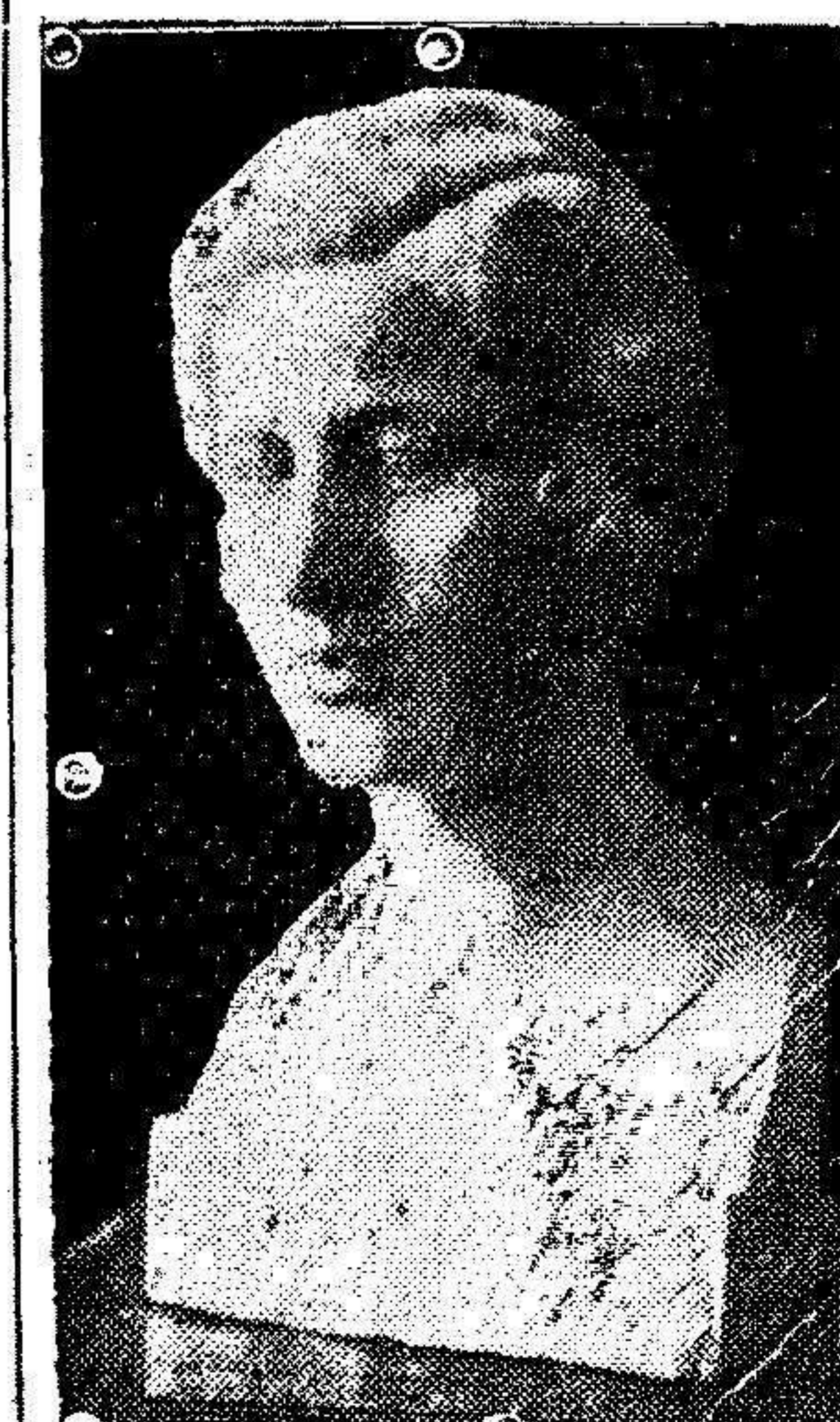
Exposición de Bellas Artes.—Busto de mujer, mármol de José Samper Ruiz

Grandes han sido los merecimientos de éste para con el Cuerpo de Correos, grande pues ha de ser también el galardón á su labor progresiva. En la memoria de todos están el Giro Postal y la Caja de Ahorros, que al entusiasmo del señor Ortuno se debieron, por lo tanto no debe extrañar á nadie la petición del Cuerpo de Correos, que nos parece muy justa y atinada.