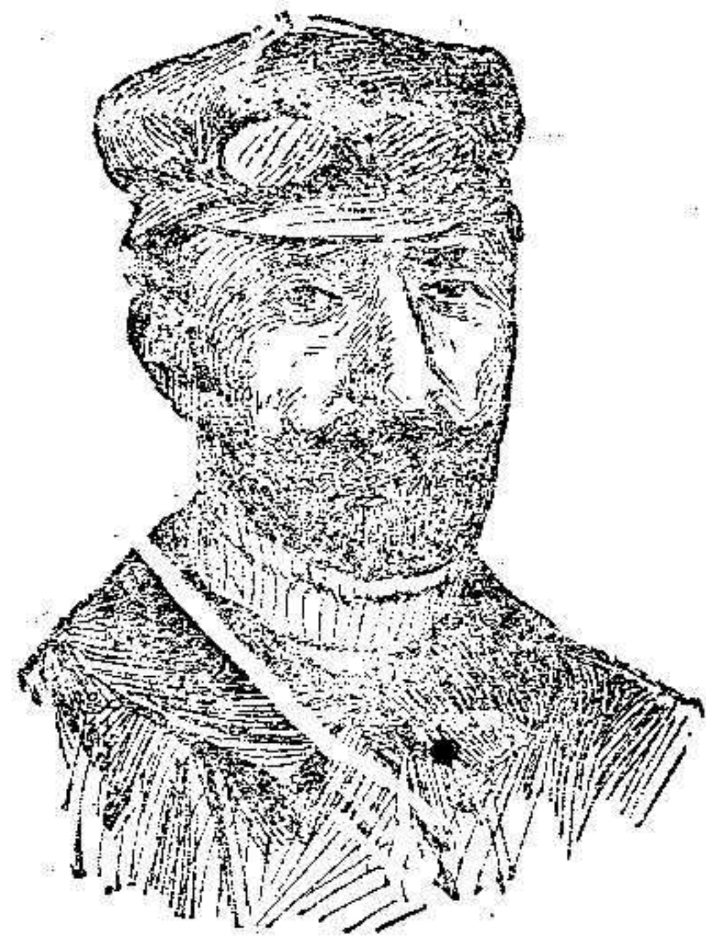
D. Pedro Vives, Coronel jefe de las escuadrillas de aerostación y aeroplanos que acaban de llegar á Marruecos.