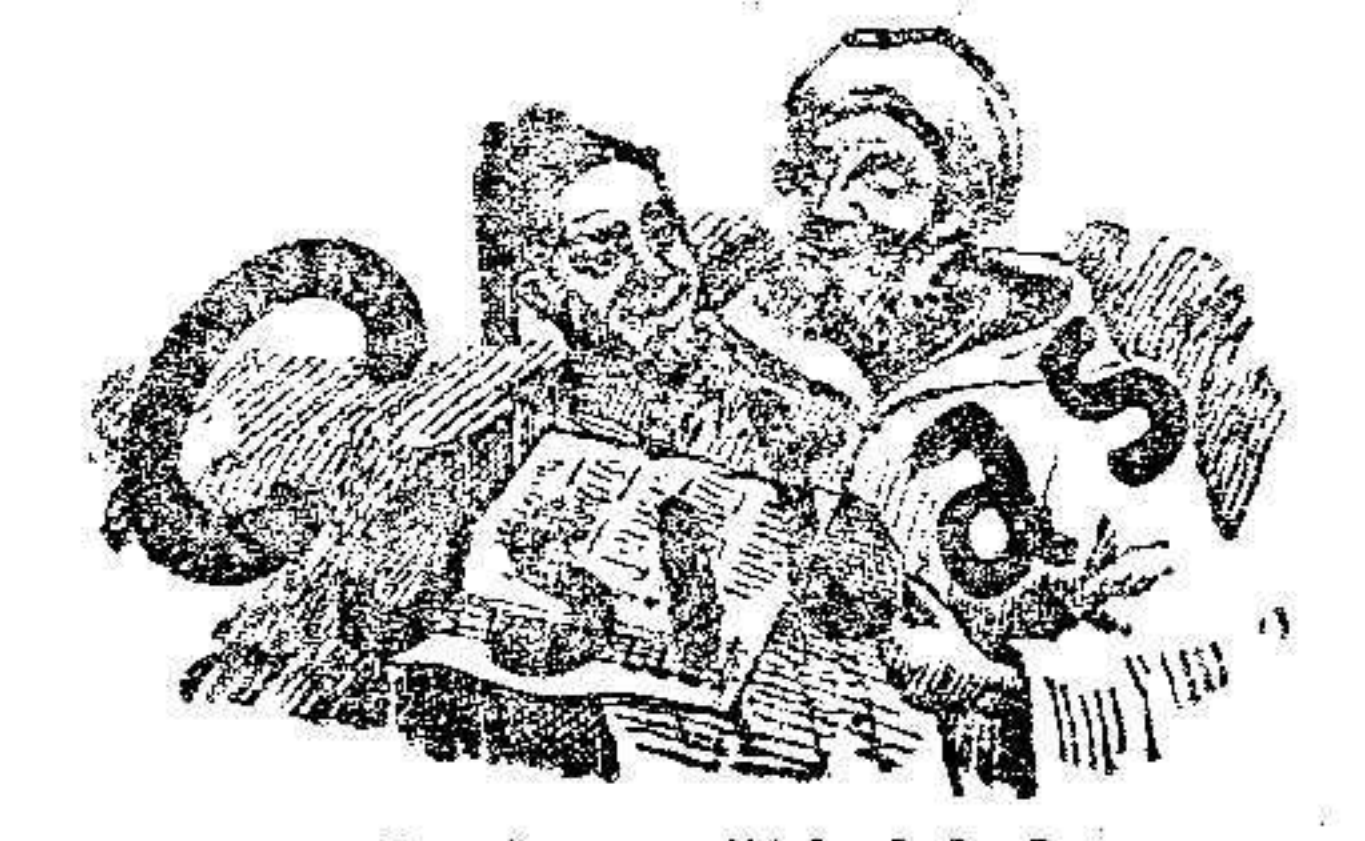
La tranquilidad de las casas