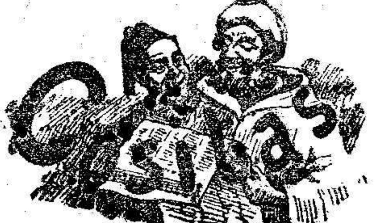
El reloj del Alfonso