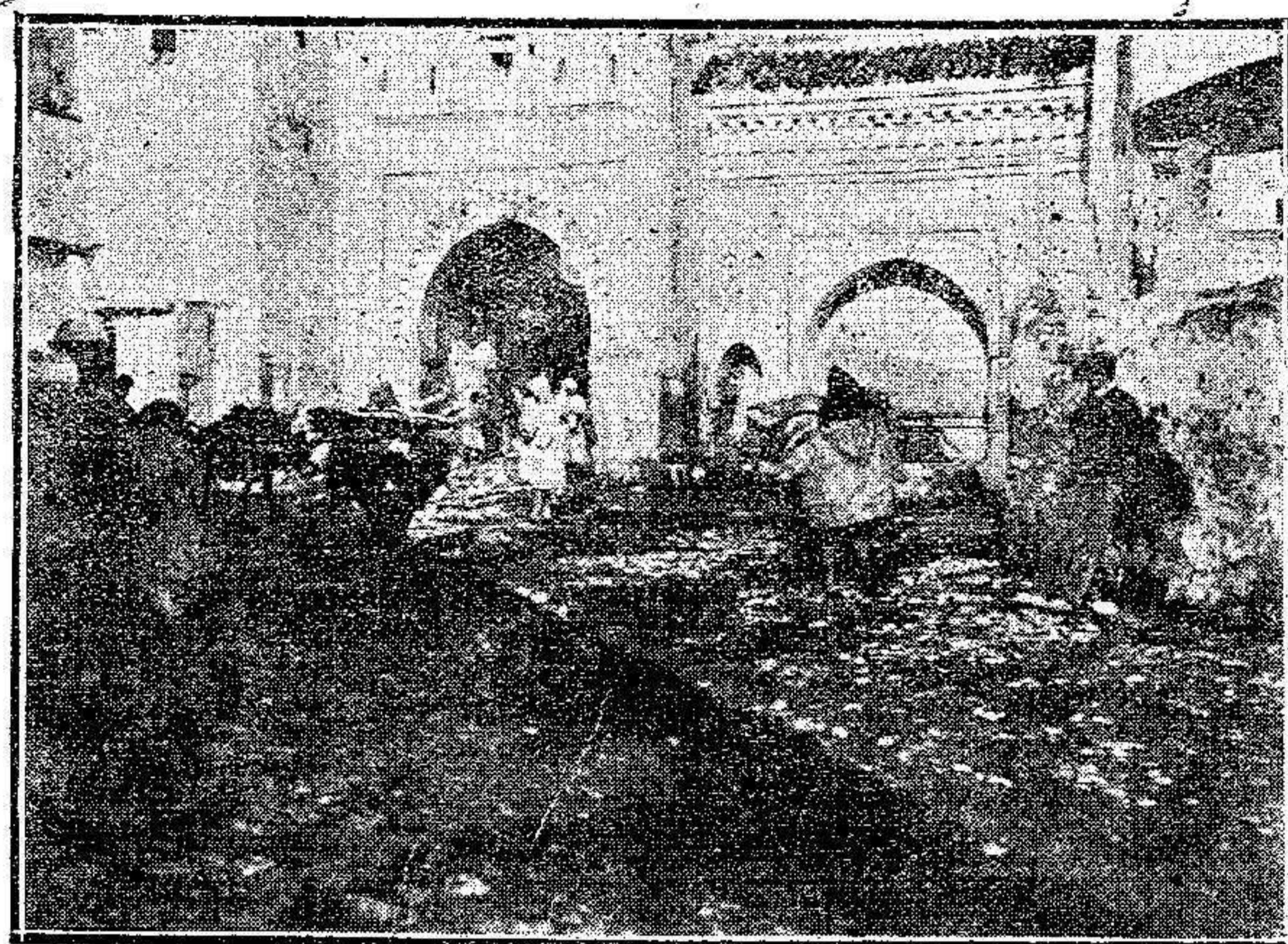
TETUAN.—Interior de la puerta llamada de Tánger