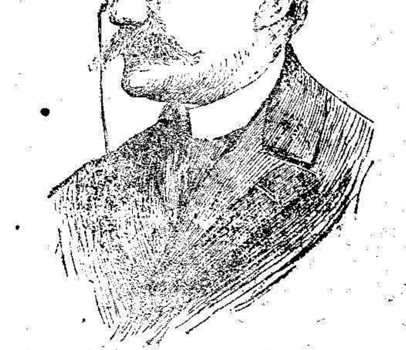
Mr. Delcassé, que como ministro de Negocios Extranjeros de Francia, negoció y firmó el tratado de 1904, que ha servido de base para las negociaciones del tratado de San Sebastián.

Como los anteriores Batallones que llegaron por primera vez á Fez, después de muchos meses de campaña, la tropa del Regimiento de África se presentó impasible, llamando la atención su marcha íntima, su elevado espíritu y su excelente aspecto.