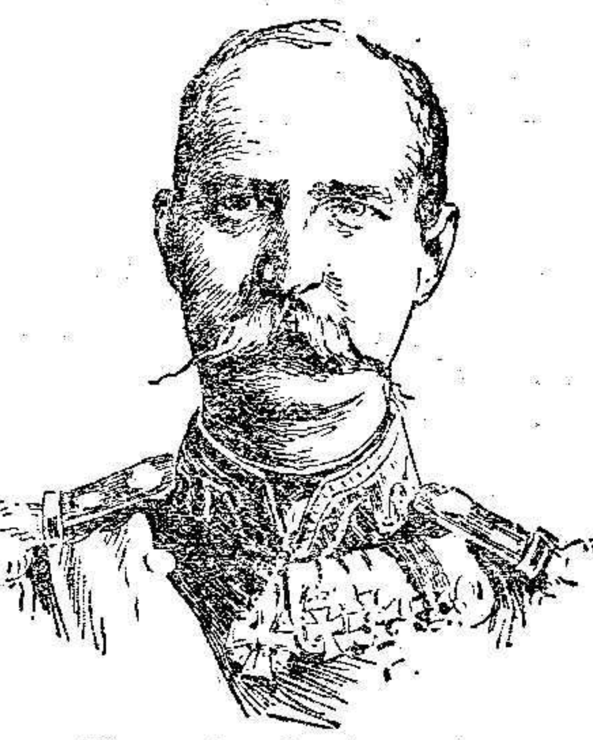
El rey Jorge I de Grecia.