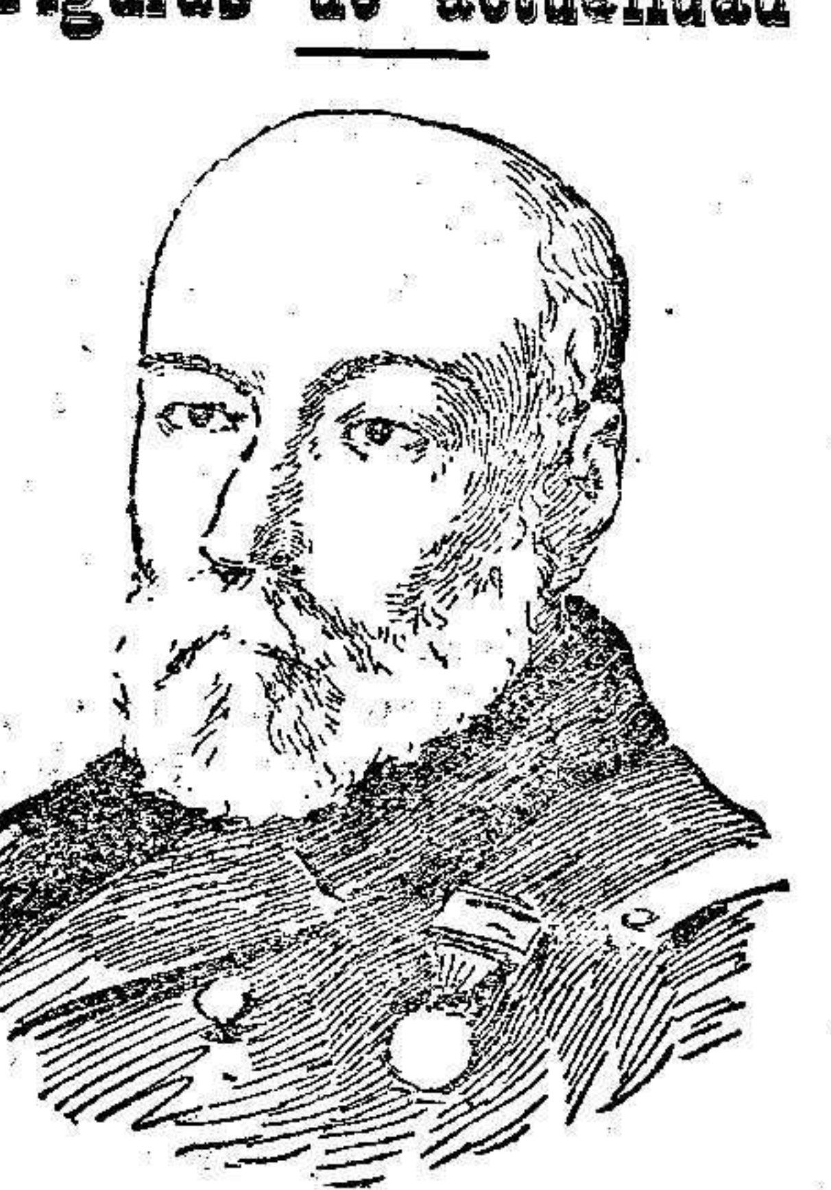
El general Pidal Ministro de Marina