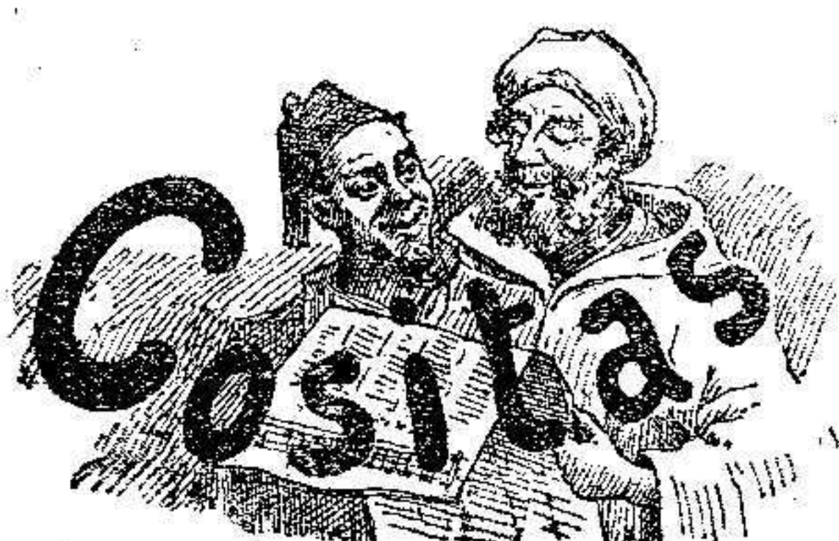
De regreso de Triana, y al atravesar el puente, sorprendí la otra mañana el diálogo siguiente.

Imposible describir la feroz expresión de cólera que apareció sobre el rostro de Nara. Sus ojos lanzaban chispas y sus manos conquisas aferraron