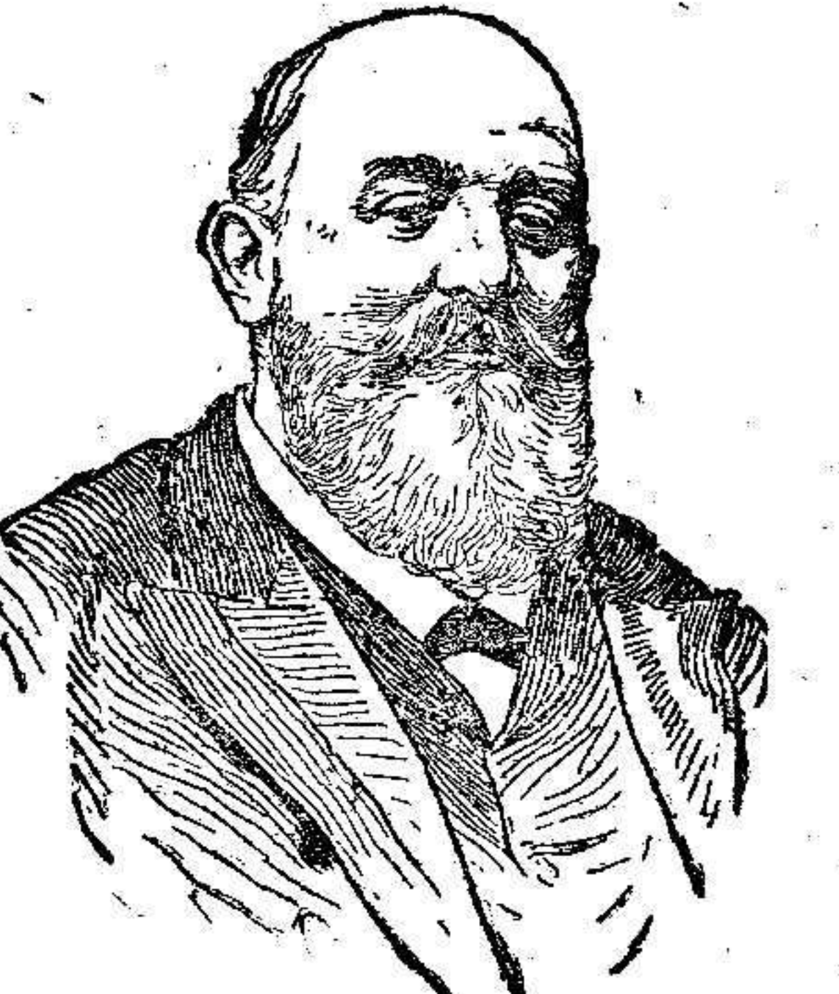
El Sr. Barroso Ministro de Gracia y Justicia