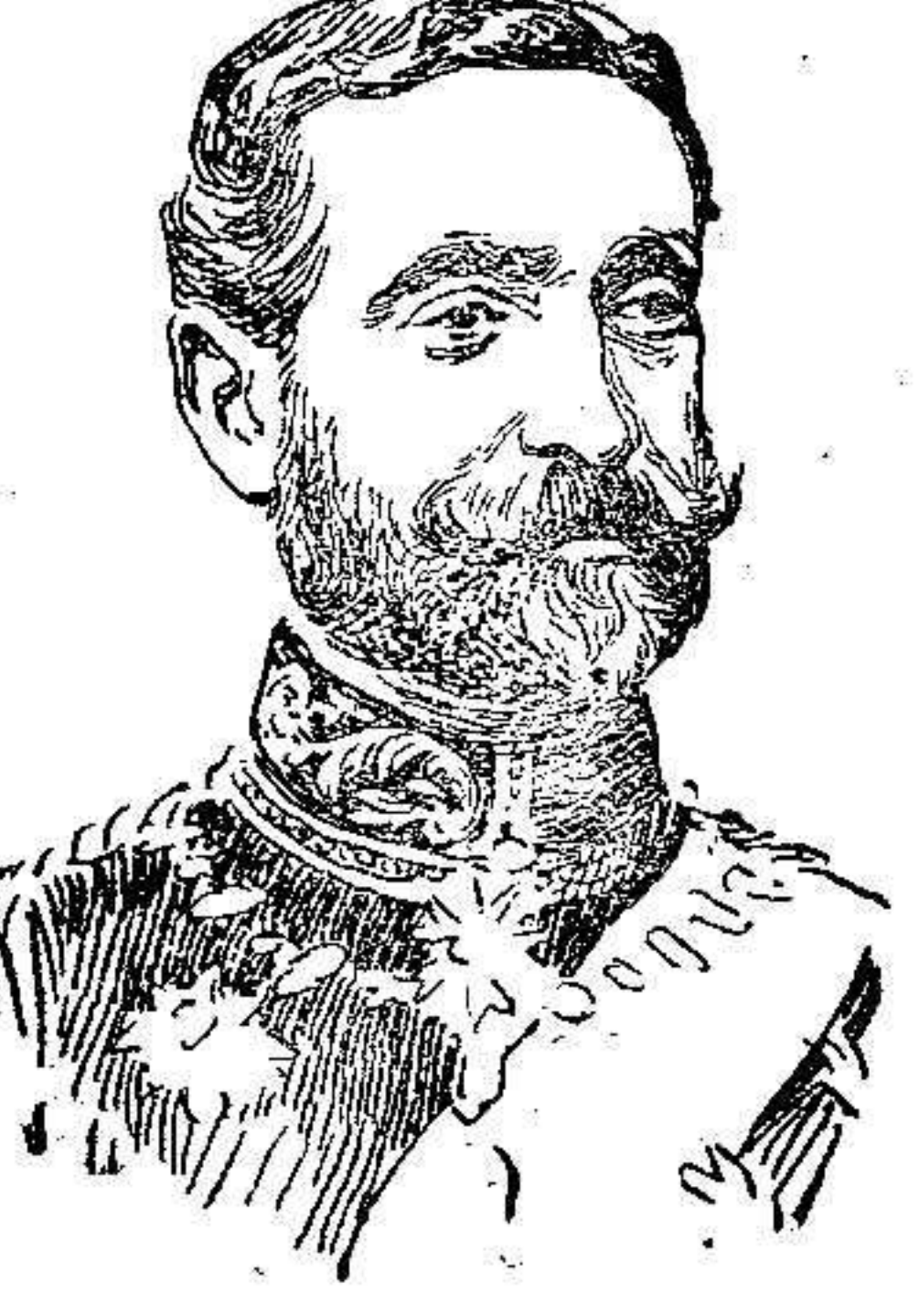
D. Ramón Piña, subsecretario de Estado, que ha tomado parte en las negociaciones con el Mekri

nir de España está en Marruecos, va abriéndose paso la convicción de que el Tratado hispano-marroquí es sumamente beneficioso para nuestra patria, por que á él han sido llevados el máximo de los beneficios á que podíamos