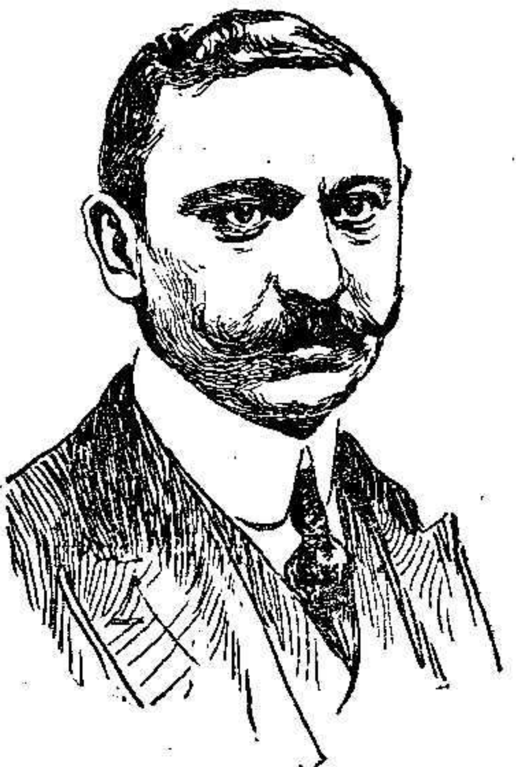
Sr. García Prieto, ministro de Estado.

Pasada la primera impresión, aun entre esos elementos que sueñan á todas horas con conquistas territoriales y que no cesan de decir que el porve-