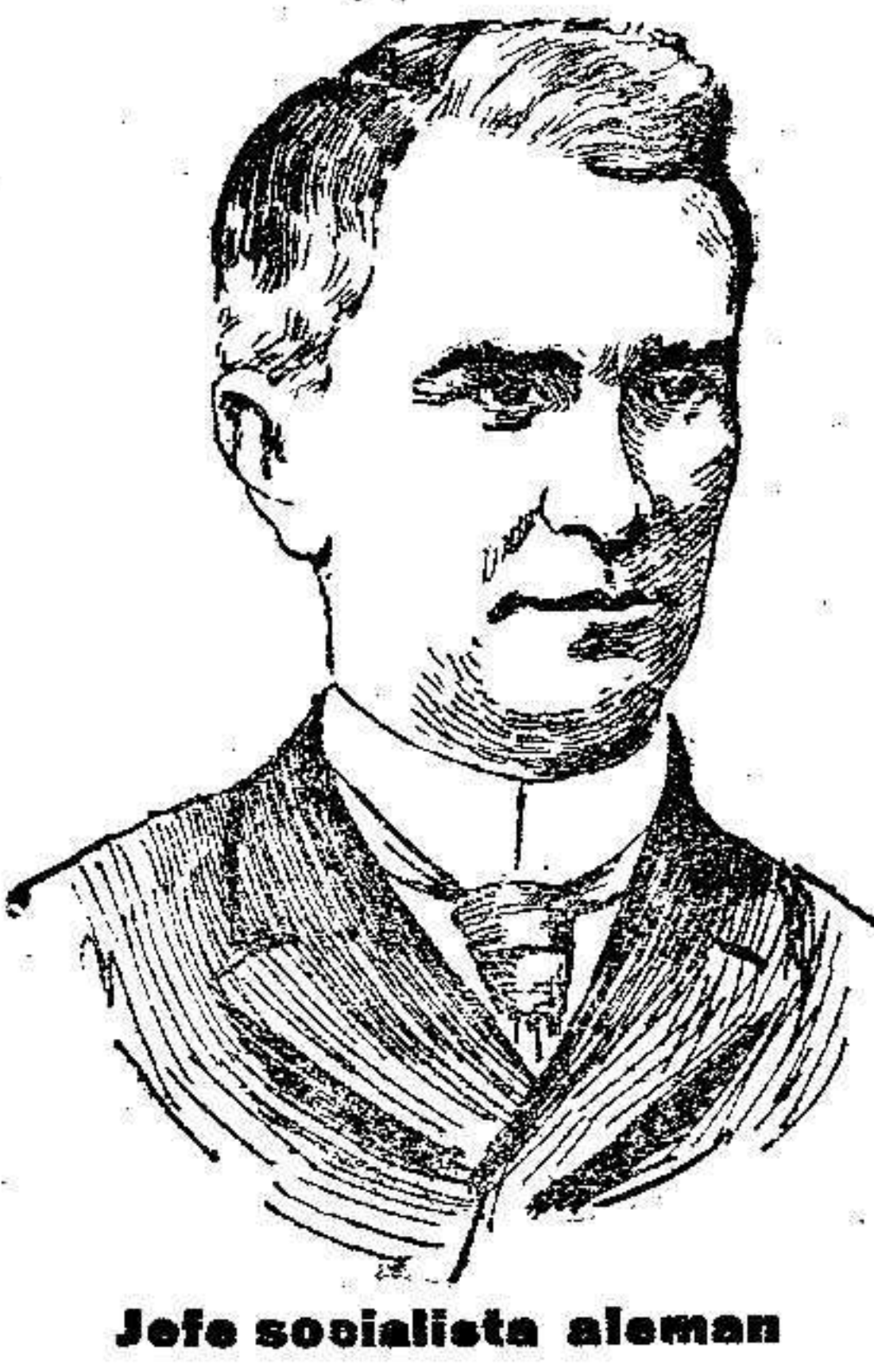
Jefe socialista alemán