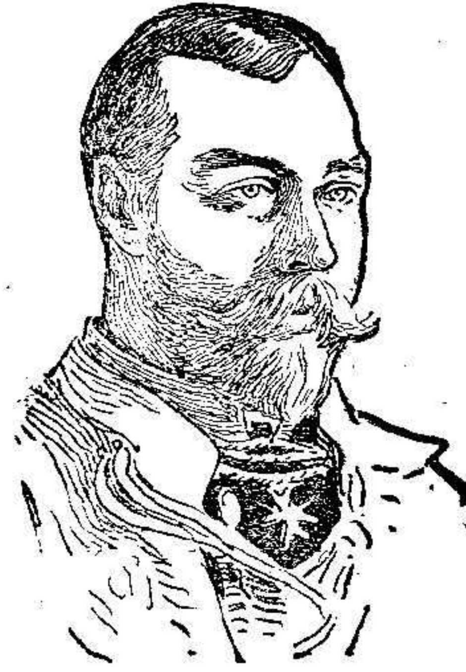
El nuevo soberano de Inglaterra, Jorge Federico.

El casi repentino fallecimiento de Eduardo VII, eleva al trono de Inglaterra al príncipe de Gales, duque de Comwall, de York y de Rotlsey, conde de Chester, de Carriz y de Inverness etc., etc.