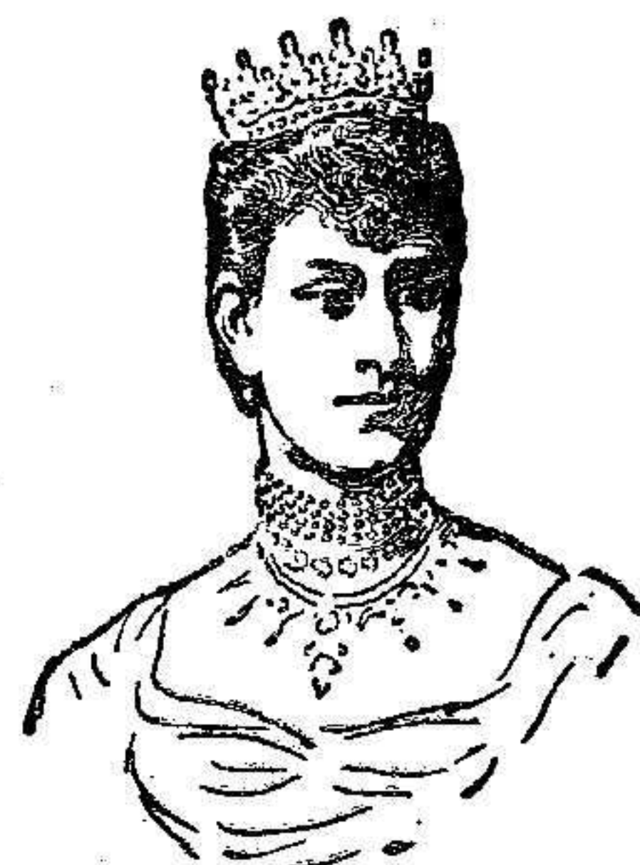
La nueva soberana de Inglaterra, Victoria María.

De carácter serio y grave, acaso debido á su constitución enfermiza, no obstante su robustez, siempre fué el príncipe Jorge Federico poco aficionado á los deportes y á las fiestas cortesanas. Pásase grandes temporadas entregado á los afectos de su esposa é hijos en Malborough House, y en determinadas épocas consagra algunos días á visitar los puertos, fabricas y talleres, para estudiar la vida del obrero, el desarrollo fabril y comercial de la nación y la actividad industrial de sus súbditos.