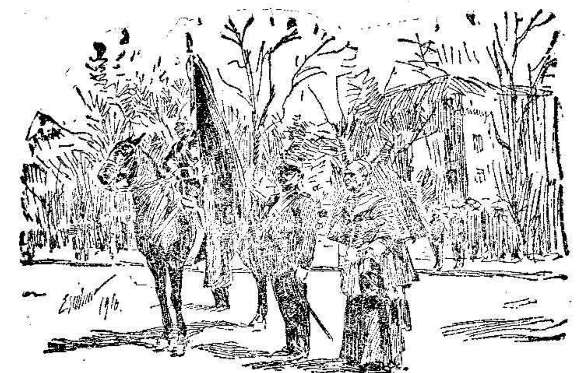
El Obispo de Sion tomando juramento á los reclutas.

do escultor de «Figulinas», con el maestro en sueños de «Teatro fantástico».