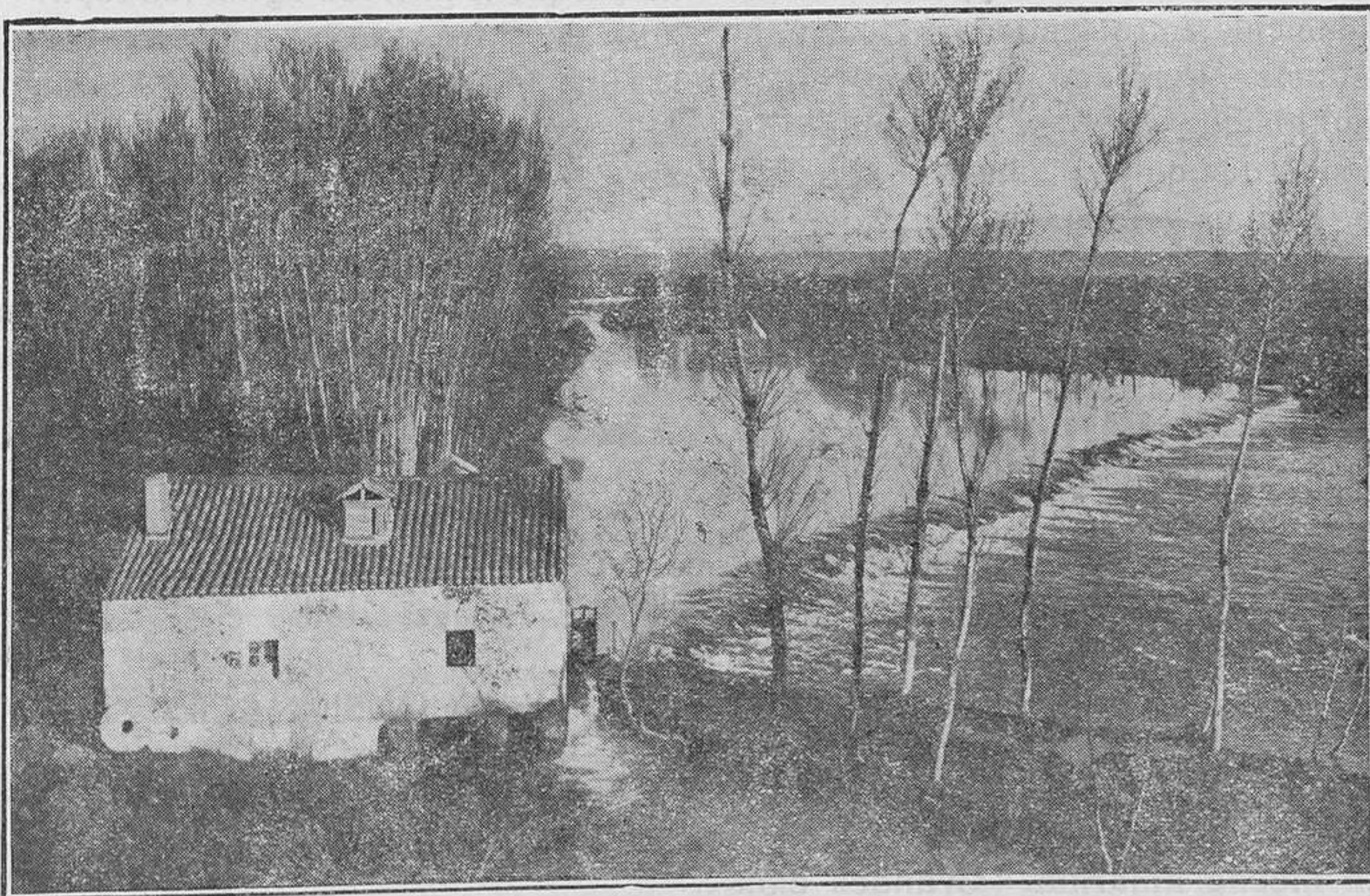
Ciudad Rodrigo.—Molino de la Aceña