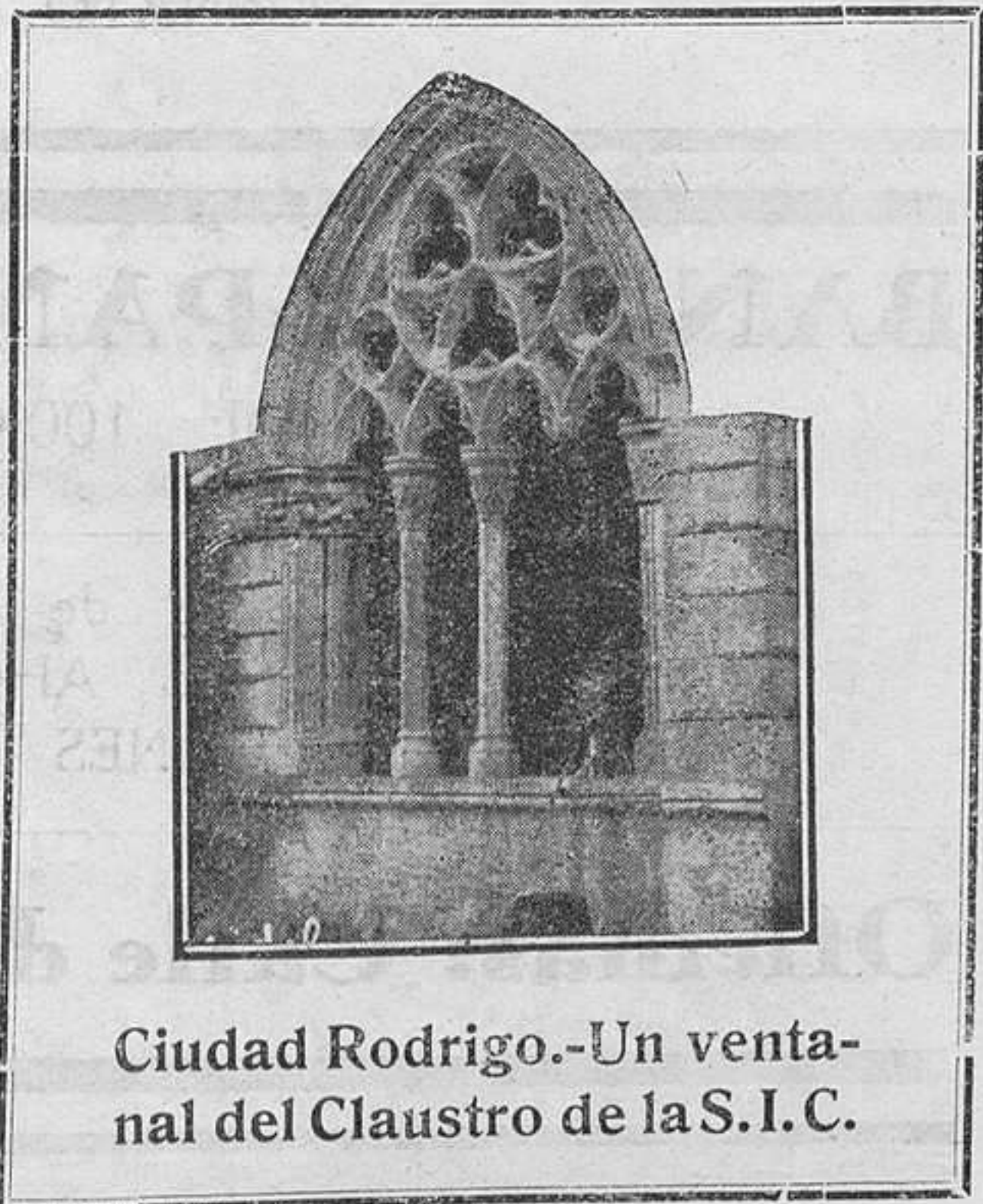
Ciudad Rodrigo.—Un ventanal del Claustro de la S.I.C.

Por todas estas razones esperamos que los propietarios, dando un alto ejemplo de comprensión y de caridad cristianas, piensen bien antes de decidirse a lanzar arrendatarios el mal que se puede seguir y derrochen cordura y sentimientos humanitarios y religiosos. Quien mayor cultura y educación tiene, debe demostrarlo más palatinamente.