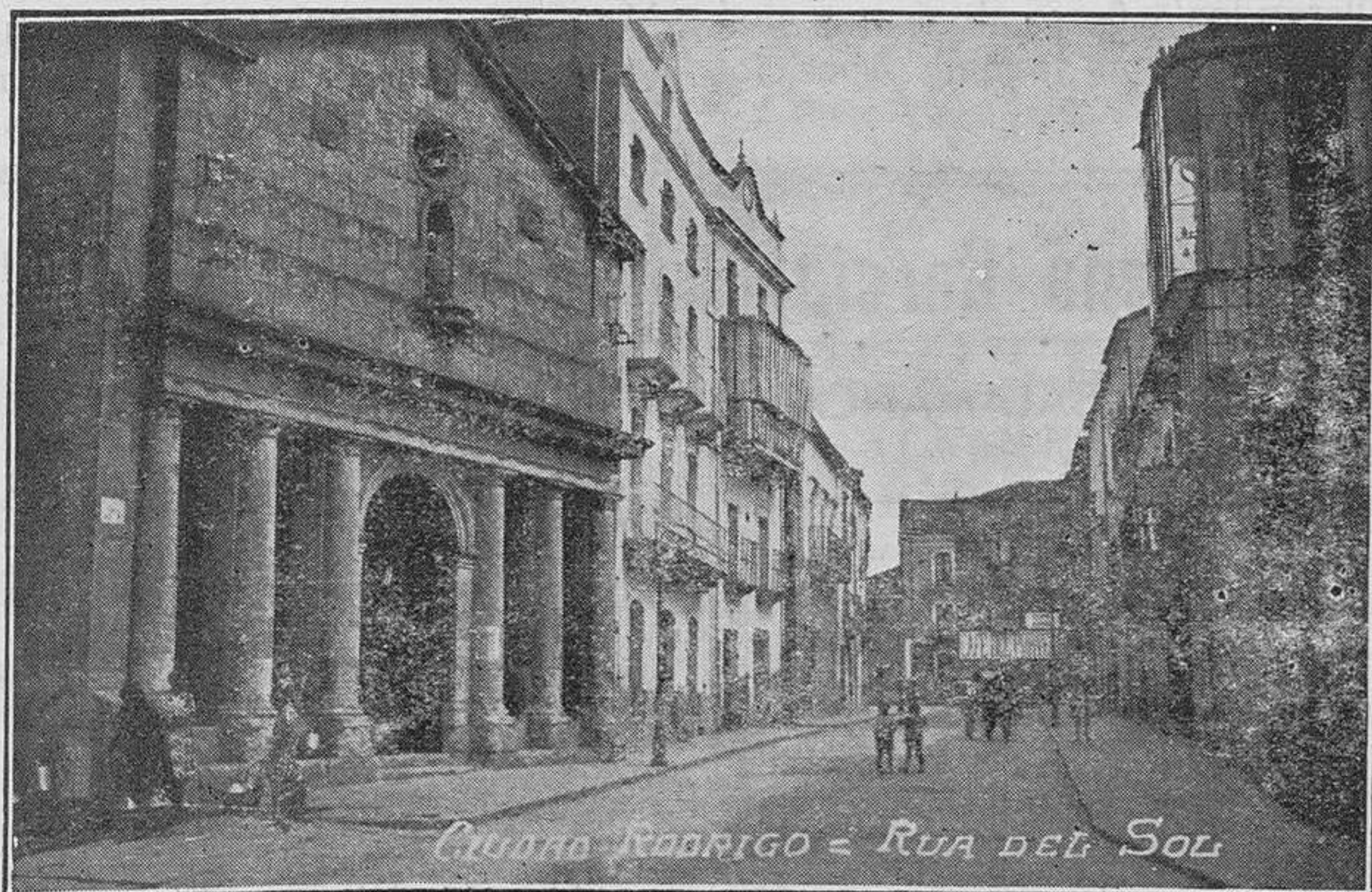
CIUDAD RODRIGO - RUA DEL SOL

Shakespeare dijo de su país, en versos suaves como perfume derramado, que es un nido de cisne en medio de las aguas. Pues bien, el 6 de mayo, ese nido de cisne fué como un templo resonante. Todo ha sido allí plegarias, efusión religiosa, himnos de fe. Las catedrales, con sus piedras mordidas por los siglos, las iglesias todas, incluso las de las más recónditas aldeas, pobres edificios de los que se enamora y a quienes besa la hiedra que los ciñe, se han iluminado en honor del Rey. Las caladas torres de los templos eminentes, con las campanas, que son su corazón de bronce; las vidrieras de colores, puro como la fe de los artífices que las esmaltaron; los labrados pórticos; los frontispicios sacros, que se han abierto camino a