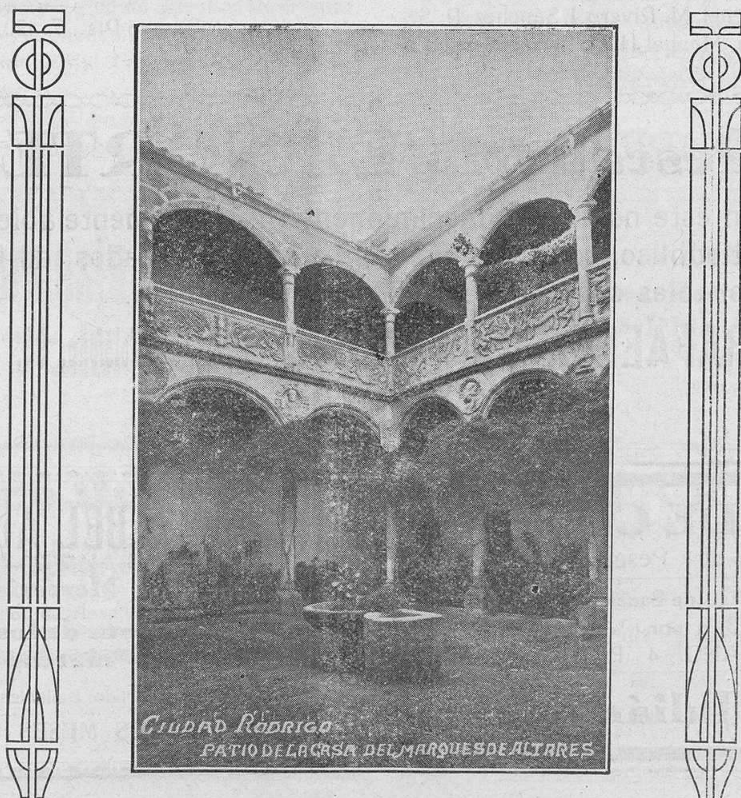
CIUDAD RODRIGO PATIO DE LA CASA DEL MARQUESE DE ALTARES

Prometimos hace varios días, refiriéndonos a este asunto, proponer alguno de los medios que considerábamos más eficaz para acabar con el hambre obrera, y hoy vamos a intentarlo. Todo el problema gira al rede-