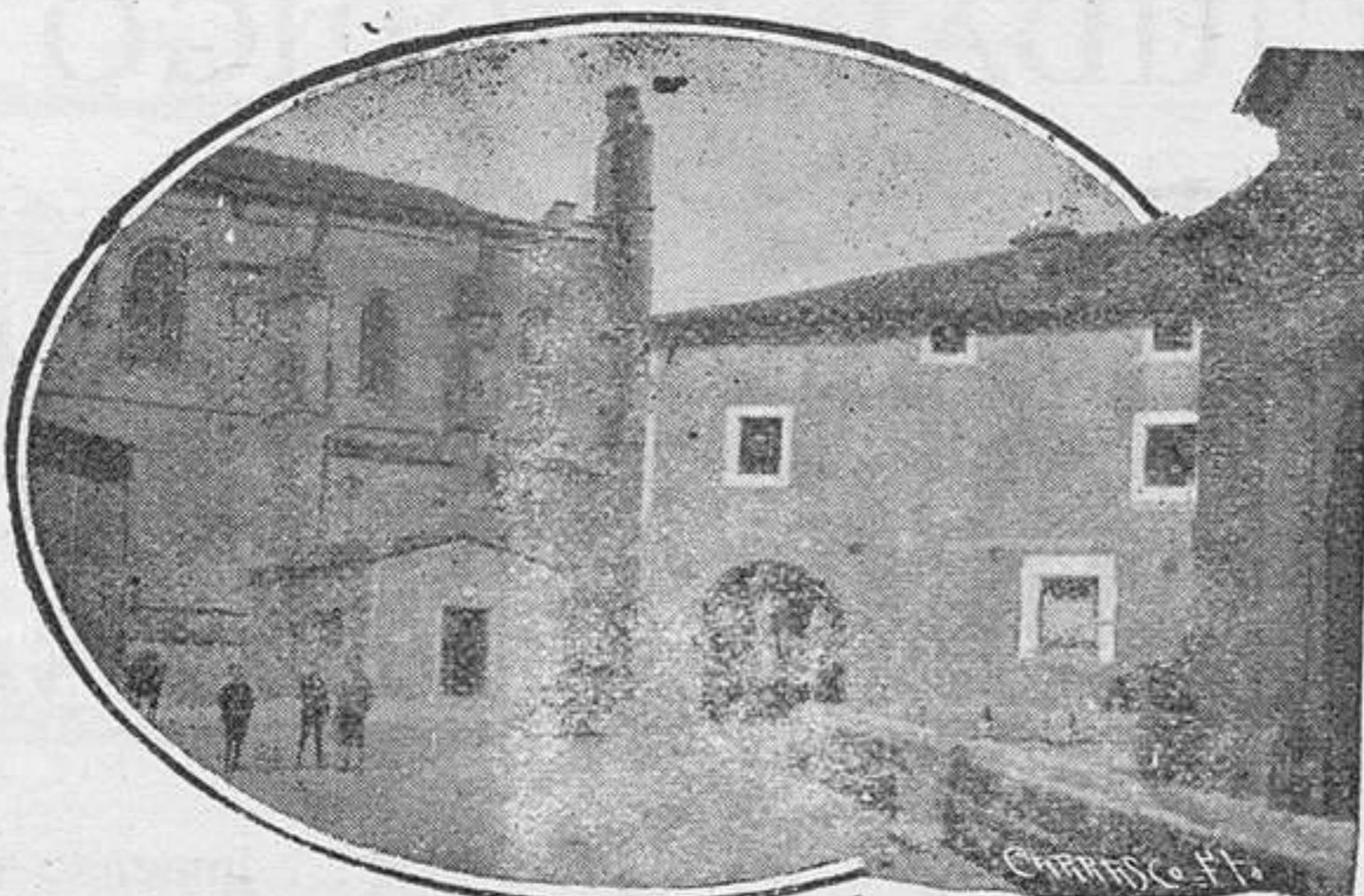
Ciudad Rodrigo.—Plaza del Poeta Cristóbal de Castillejo

2.º Esta igualdad no es el igualitarismo. —El igualitarismo fué la gran