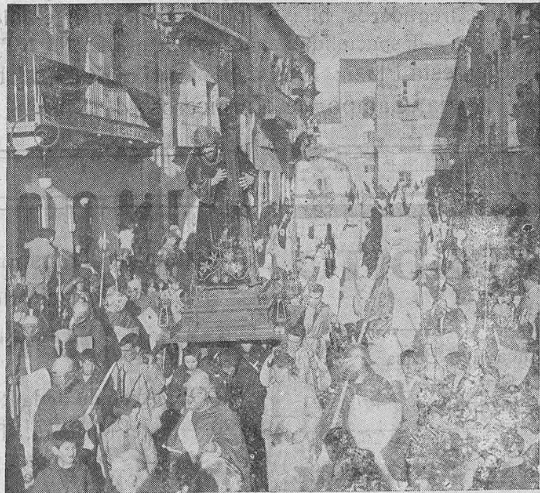
Ciudad Rodrigo.--Paso de Jesús Nazareno