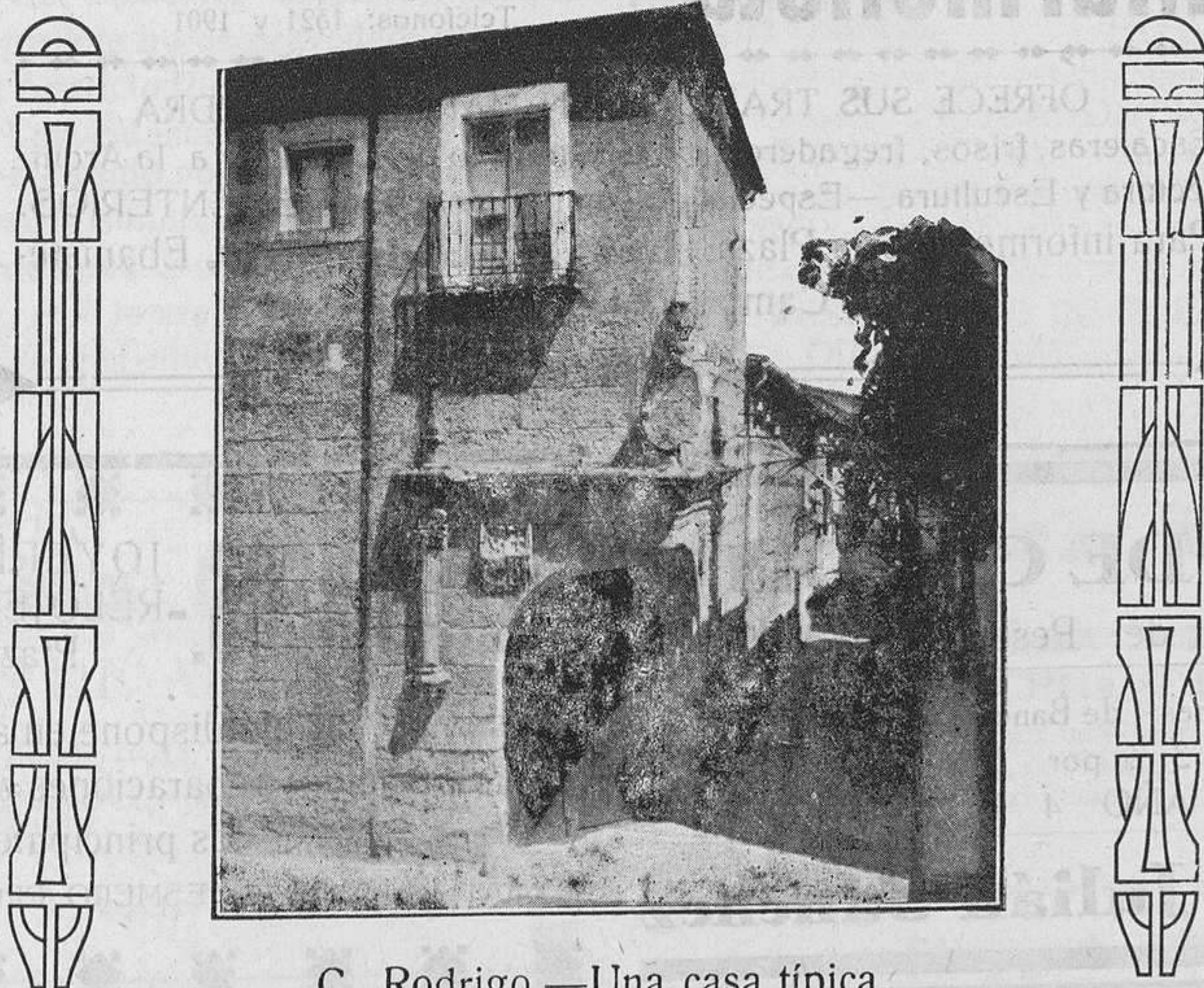
C. Rodrigo.—Una casa típica.

No es decir por decir. Con la historia en la mano puede ir comprobando cuales sean las empresas y los monumentos no inspirados por nuestra fe; y si todo eso hubiésemos de hacer-