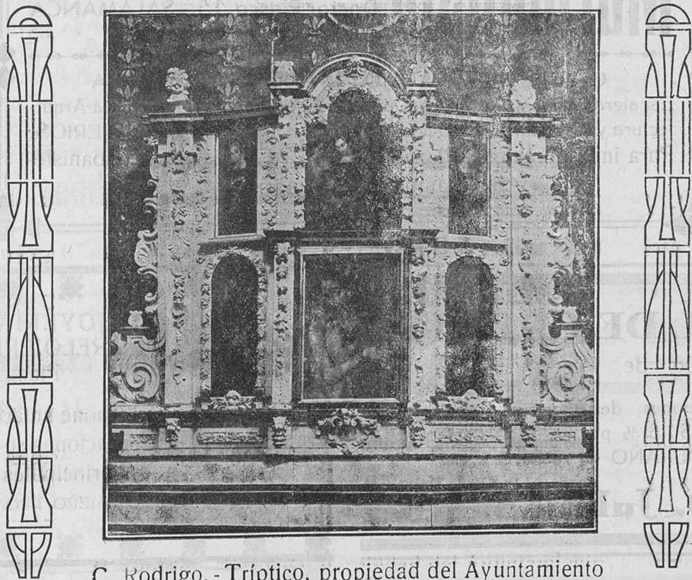
C. Rodrigo. - Tríptico, propiedad del Ayuntamiento

El presupuesto nacional ha aumentado, en los dos últimos años, en 900 millones. ¿Cuántos de ellos han llegado a los obreros? Nunca han existido tantos parados como ahora.