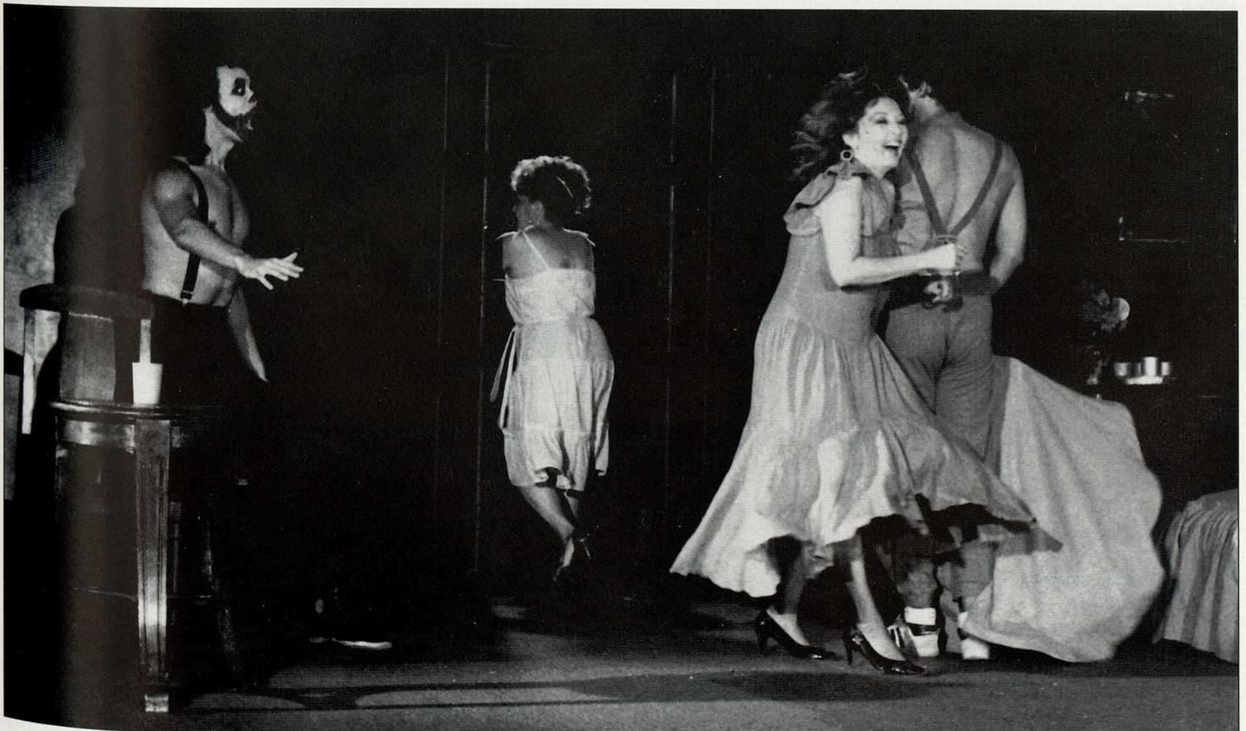
"Para matar a Carmen". Autor y director: José Milián. Pequeño Teatro de La Habana. (1990).