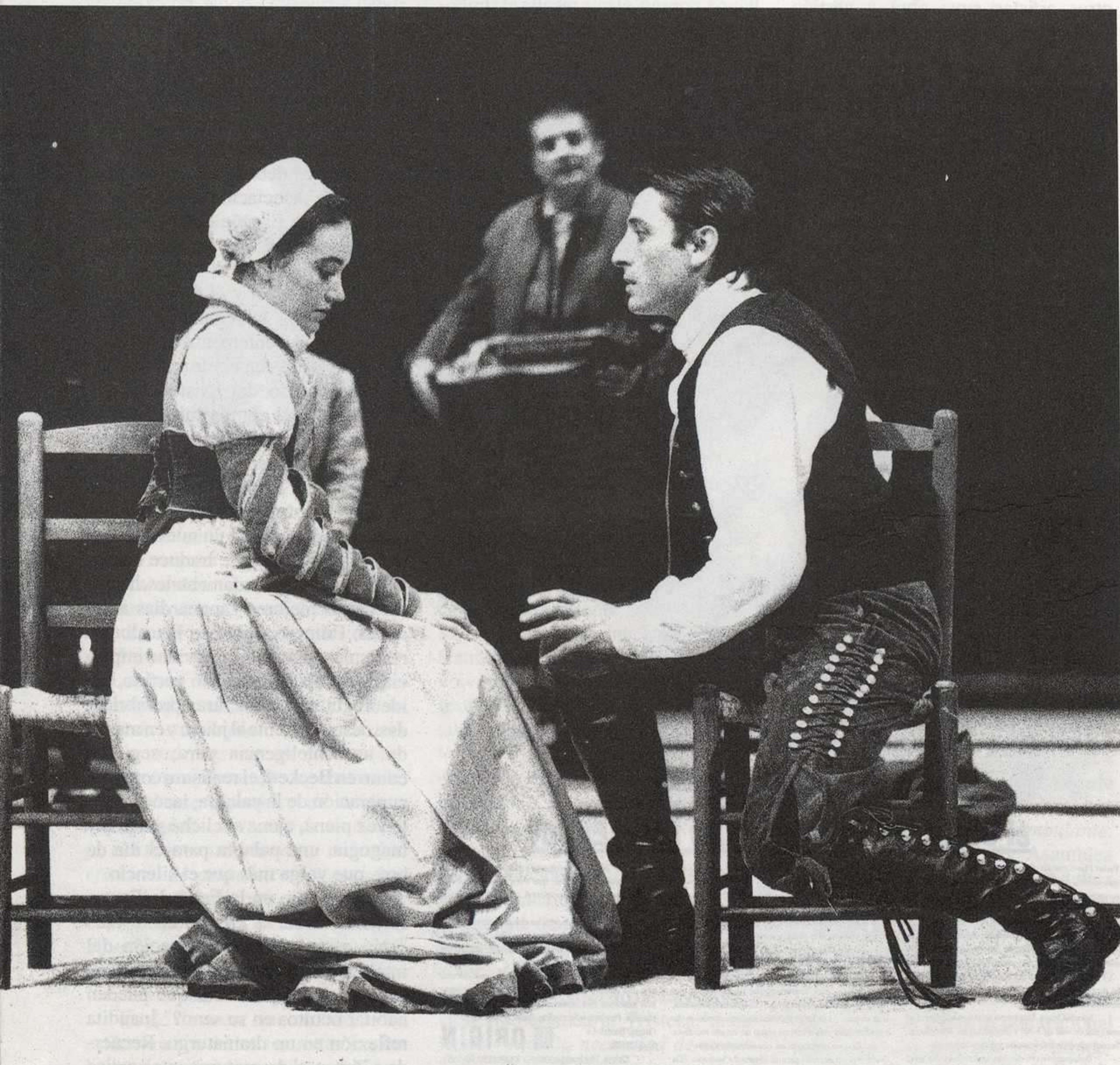
"El caballero de Olmedo" de Lope de Vega; CNTC; dirección: Miguel Narros.

En cuanto al "propósito", teniendo en cuenta que "ese" contenido