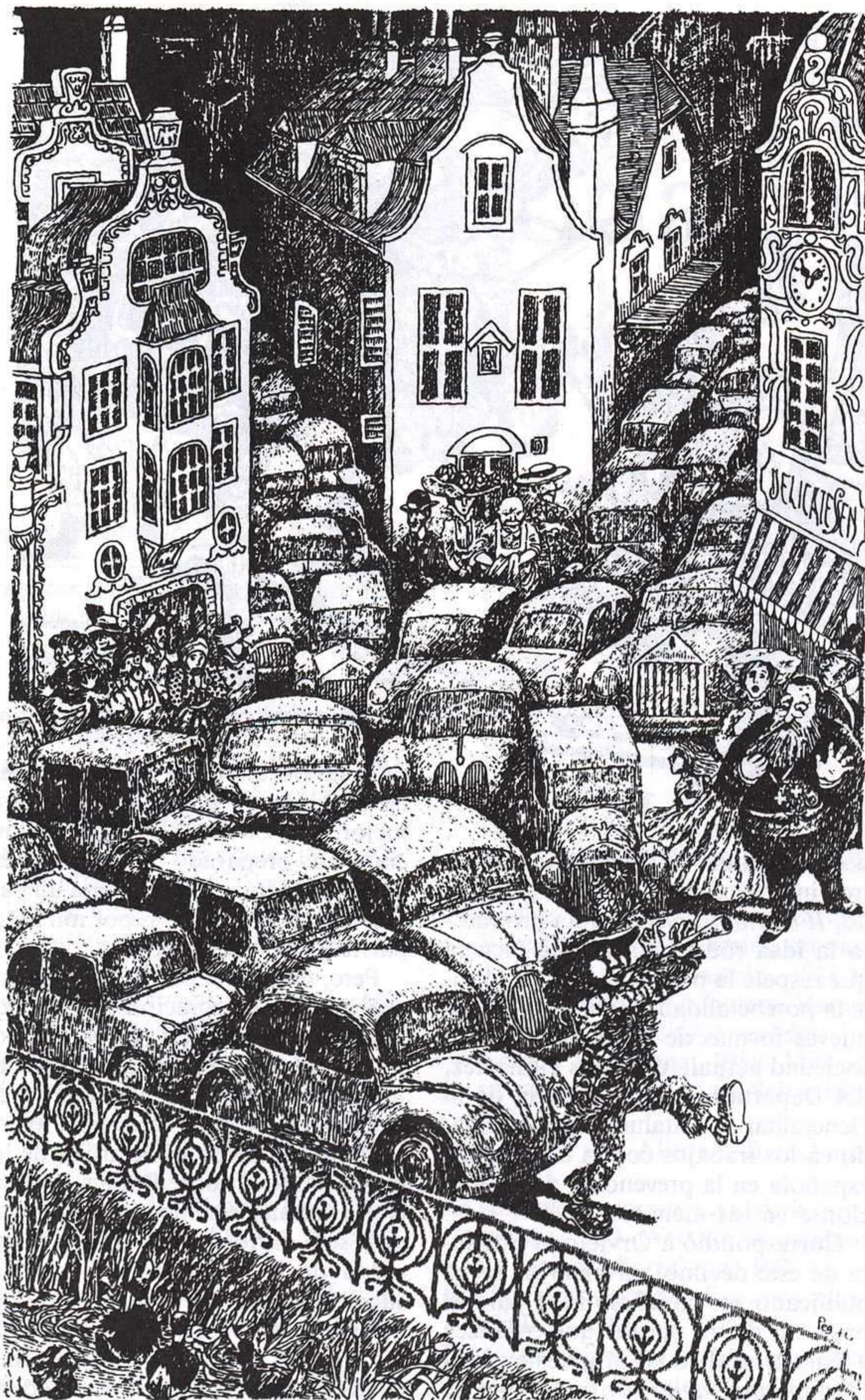
GIANNI PEG, MOLTS CONTES PER JUGAR, ALFAGUARA, BARCELONA, 1988.

diantes y todos cuantos trabajan en la educación. El programa consiste en hacer investigaciones sobre la creatividad infantil, promover iniciativas