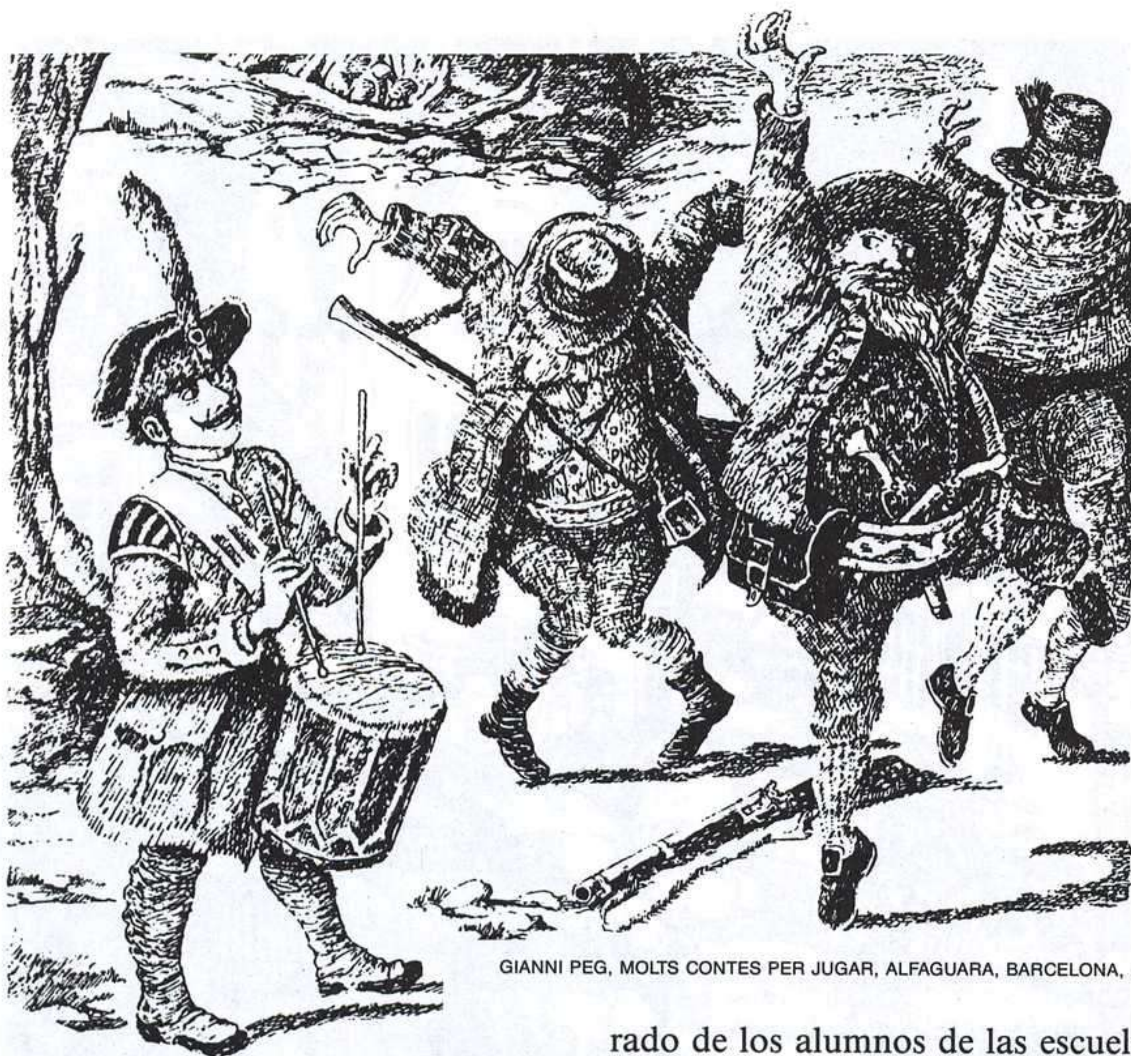
GIANNI PEG, MOLTS CONTES PER JUGAR, ALFAGUARA, BARCELONA, 1988.

Ninguna de las manifestaciones del Comité ha sido una celebración estéril. Omegna, ciudad natal de Rodari, ha recogido en un libro los aspectos menos conocidos de su actividad. Reggio Emilia, en cuyas escuelas Gianni experimentó la Grammatica della fantasia , ha proclamado la gran «caza del tesoro en los lugares de lectura», entregando por un día a los chicos las plazas y las calles, las librerías y las bibliotecas. Rosignano Marittimo, al organizar conjuntamente con la Coordinadora de Padres Democrá-