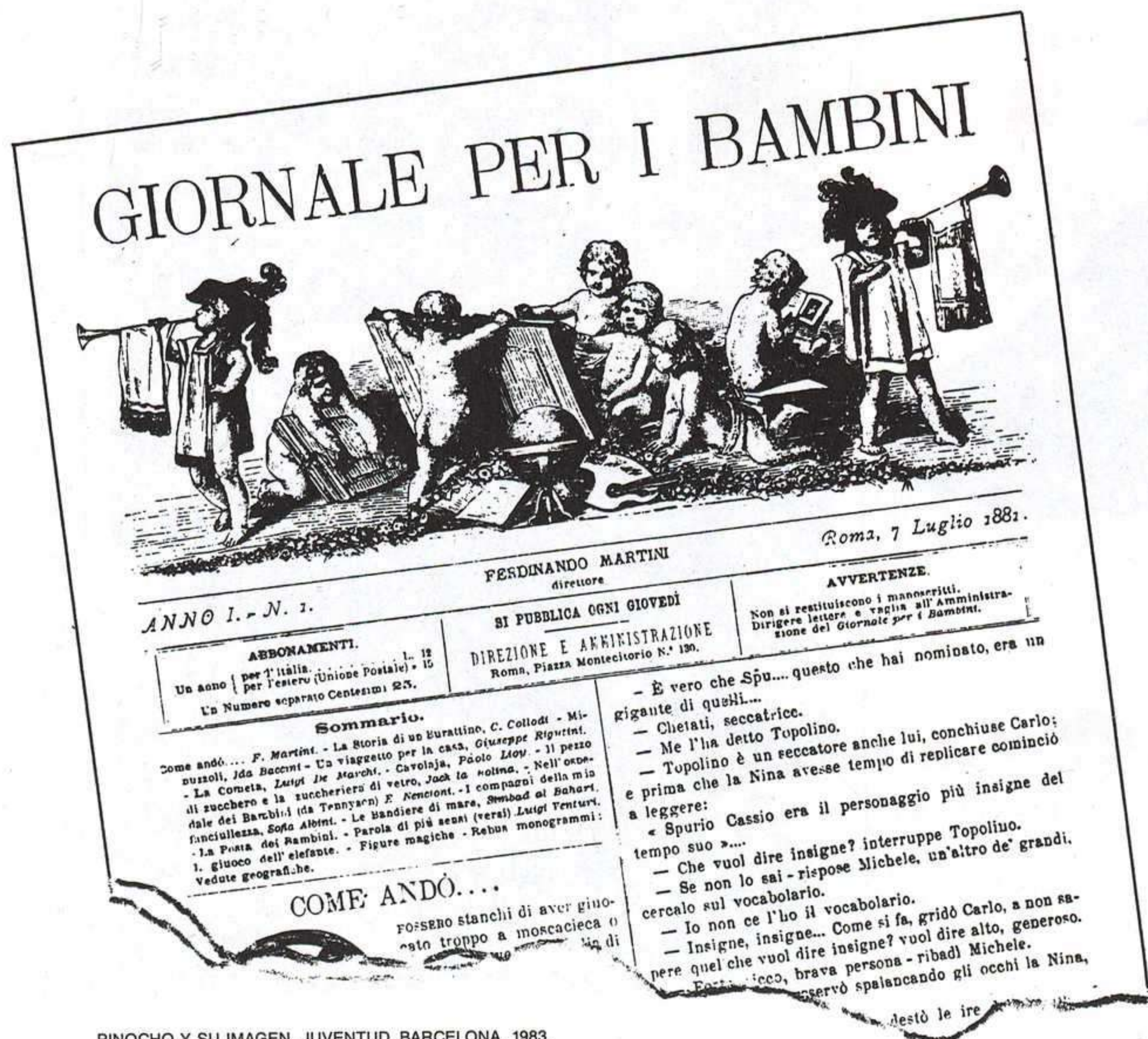
PINOCHO Y SU IMAGEN, JUVENTUD, BARCELONA, 1983.

Italia ha venido celebrando a lo largo de este año, el primer centenario de la muerte del escritor y periodista Carlo Collodi, autor de «Las Aventuras de Pinocho», uno de los textos clásicos de la literatura infantil de todos los tiempos. A modo de particular homenaje, ofrecemos desde estas páginas una breve semblanza biográfica del autor, junto con un trabajo, firmado por Rafael Sánchez Ferlosio, que es uno de los más sugerentes estudios sobre «Las aventuras de Pinocho» que se han hecho en España.