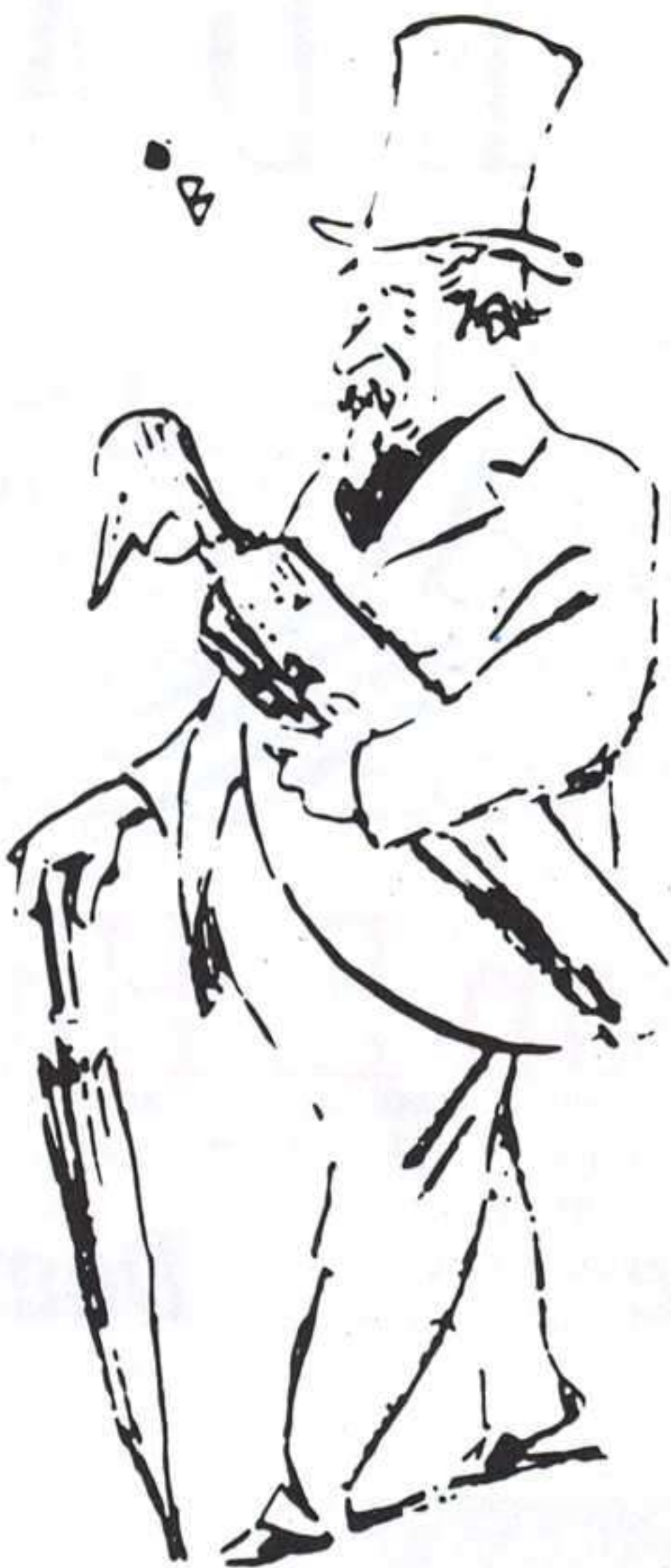
Caricatura de Carlo Collodi.

Pero, entre tanto, Collodi no abandona su práctica periodística y continúa su infatigable presencia en los diarios de la época con agudos y punzantes artículos que subrayan las debilidades de la sociedad italiana de aquel entonces. A resultas del centenario de su muerte, todos estos escritos están en vías de publicación y se asomarán a los escaparates de las librerías italianas antes de que el año finalice.