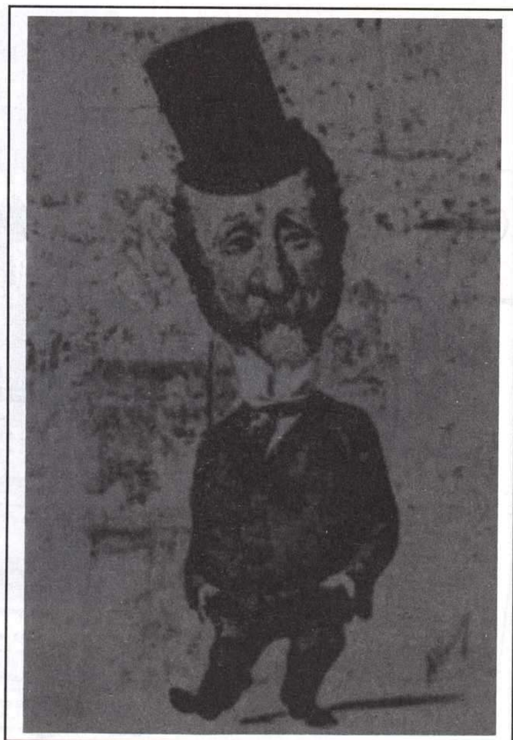
Dos caricaturas de Carlo Collodi.