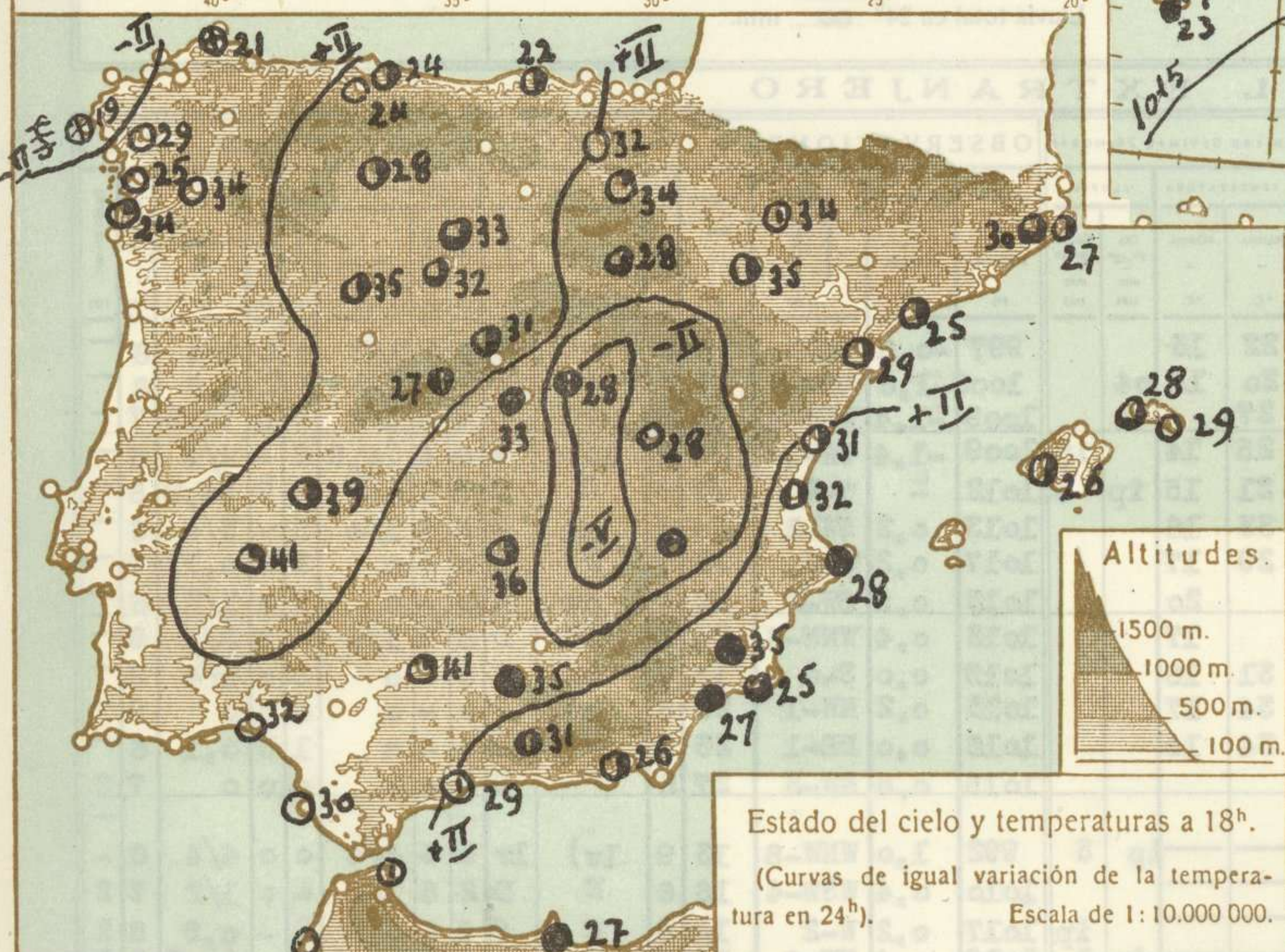
Estado del cielo y temperaturas a 18 h . (Curvas de igual variación de la temperatura en 24 h ). Escala de 1: 10.000.000.